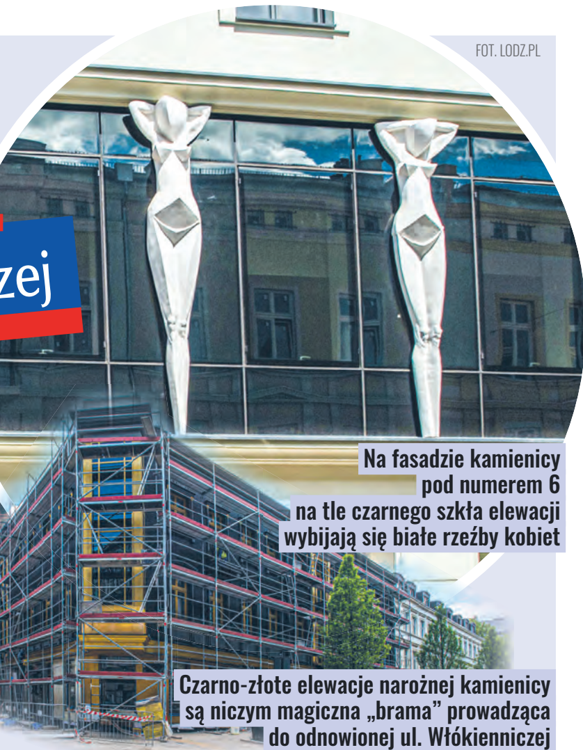
Na fasadzie kamienicy pod numerem 6 na tle czarnego szkła elewacji wybijają się białe rzeźby kobiet

sprawą prywatnych inwestorów. Po parzystej stronie inwestuje Atlas Sztuki, natomiast po nieparzystej, na rogu z Kilińskiego, deweloper remontuje kamienicę, w której będzie sprzedawał mieszkania.