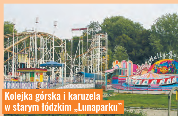
Kolejka górską i karuzela w starym łódzkim „Lunaparku”

chem wojny, a ogród botaniczny dopiero w latach 60. XX wieku. Natomiast w 1974 roku uruchomiono na Zdrowiu Łódzki Park Rozrywki - Lunapark Łódź, który stał się miejscem spotkań ludzi. W wesołym miasteczku znajdowało się 38 różnych atrakcji, m.in. jedna z najwyższych w Polsce, 16-me-