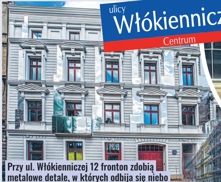
Przy ul. Włókiennicznej 12 fronton zdobią metalowe detale, w których odbija się niebo