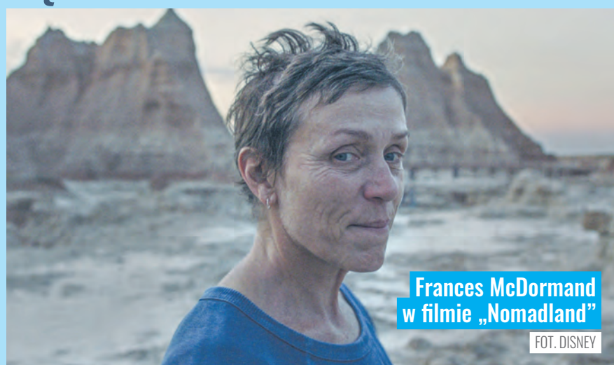
Frances McDormand w filmie „Nomadland”