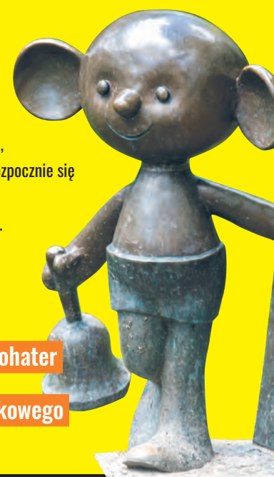
Plastuś - bohater łódzkiego Szlaku Bajkowego