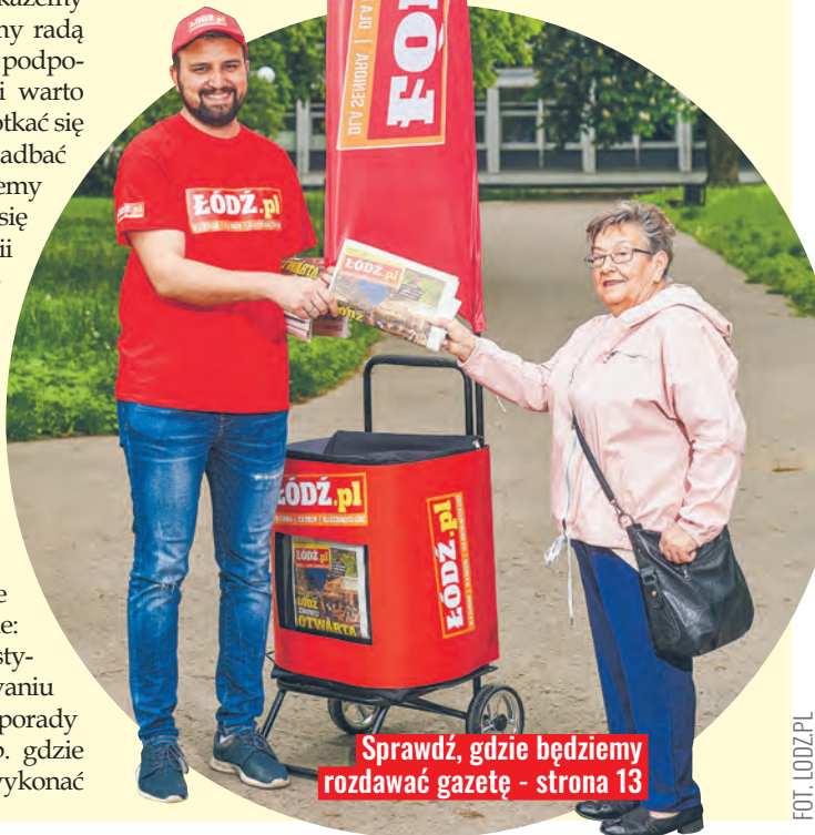
Sprawdź, gdzie będziemy rozdawać gazetę - strona 13