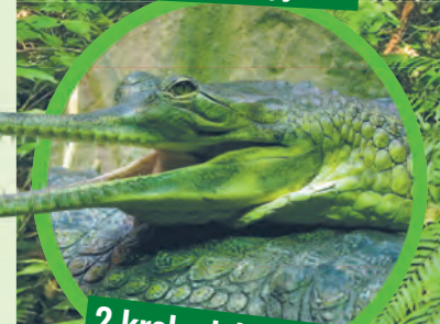
2 krokodyle gawiale