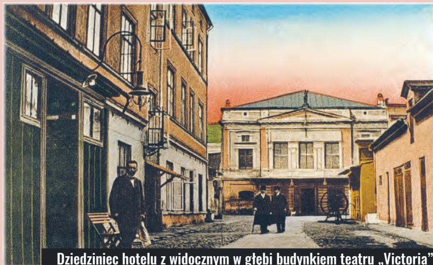
Dziedziniec hotelu z widocznym w głębi budynkiem teatru „Victoria” przy ul. Piotrkowskiej 67 na pocztówce z początku XX wieku