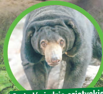
2 niedźwiedzie azjatyckie