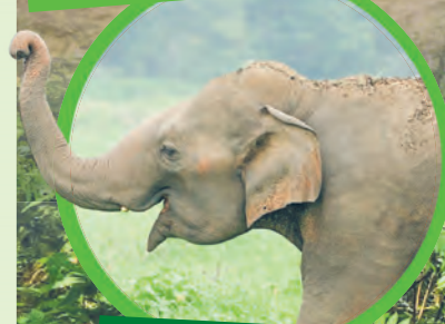
3 słonie indyjskie