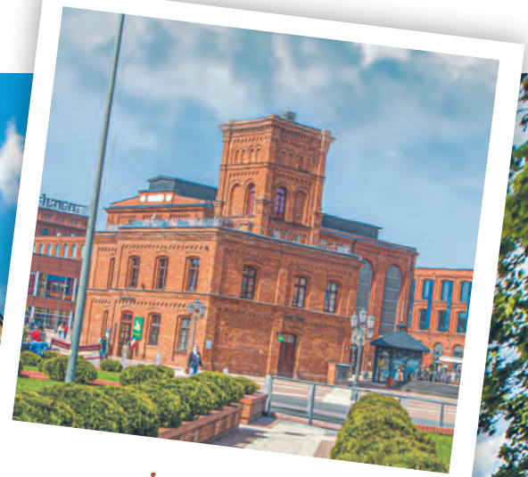
i po rewitalizacji!