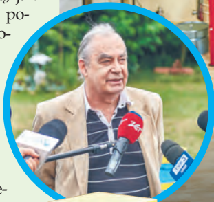
W ZSR powstała pracownia pszczelarska