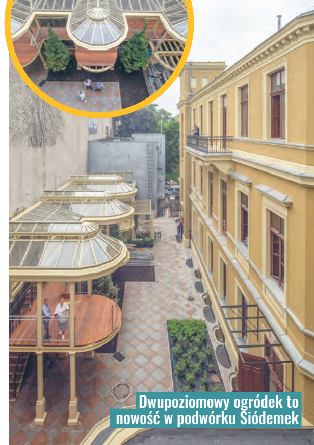
Dwupoziomowy ogródek to nowość w podwórku Siódemek