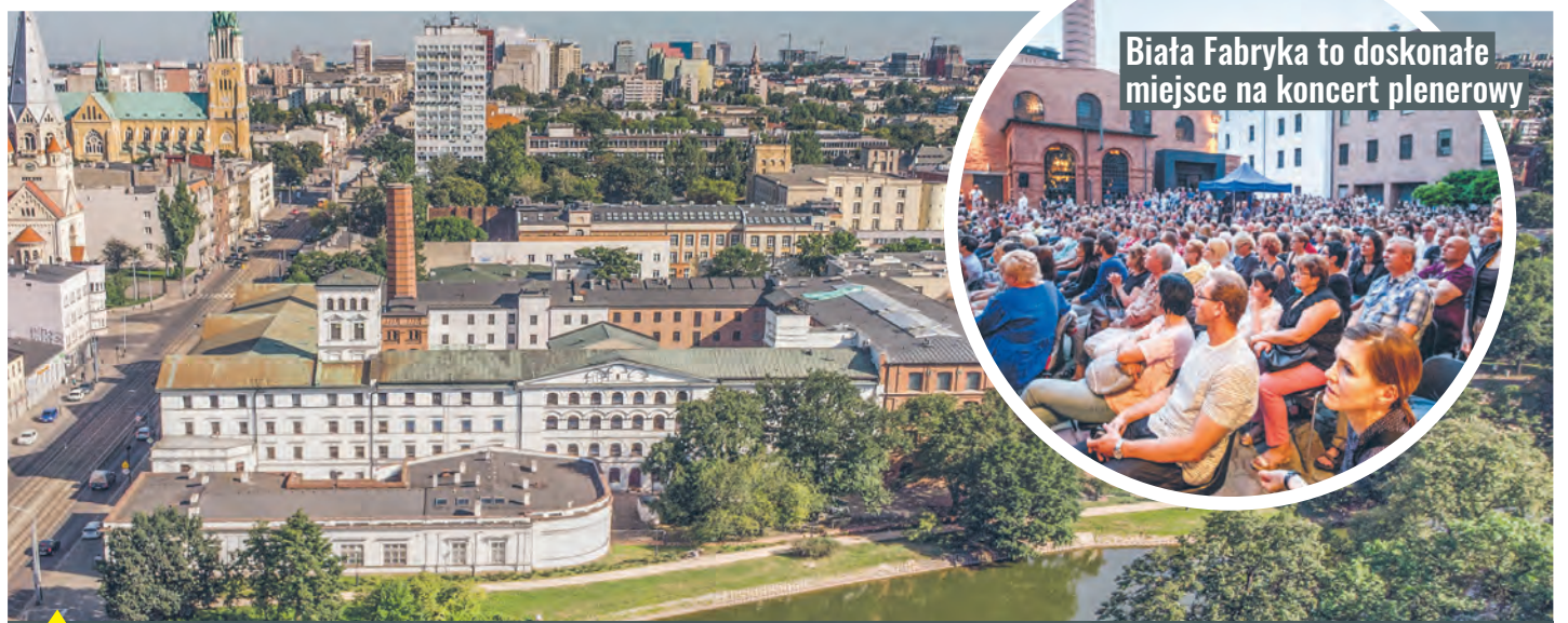
Biała Fabryka to doskonałe miejsce na koncert plenerowy

To największy projekt nadania drugiego życia dawnym łódzkim fabrykom. Ogromny teren 27 hektarów, które Apsys zamienił w centrum handlowo-rozrywkowo-gastronomiczne. Mamy tu sklepy, kawiarnie, restauracje, Muzeum Fabryki i filię Muzeum Sztuki – ms 2 . Jest czterogwiazdkowy andel's Hotel z panoramicznym basenem na dachu, kręgielnia, klub sportowy, kino, a w centrum rynek Włókniarek Łódzkich, który latem zamienia się w plażę.