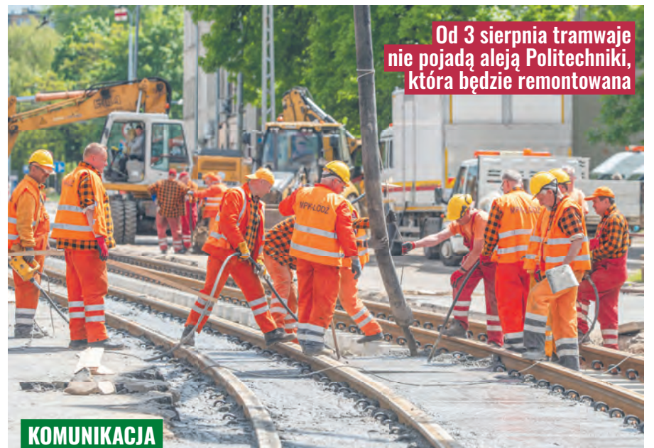
Od 3 sierpnia tramwaje nie pojadą aleją Politechniki, która będzie remontowana