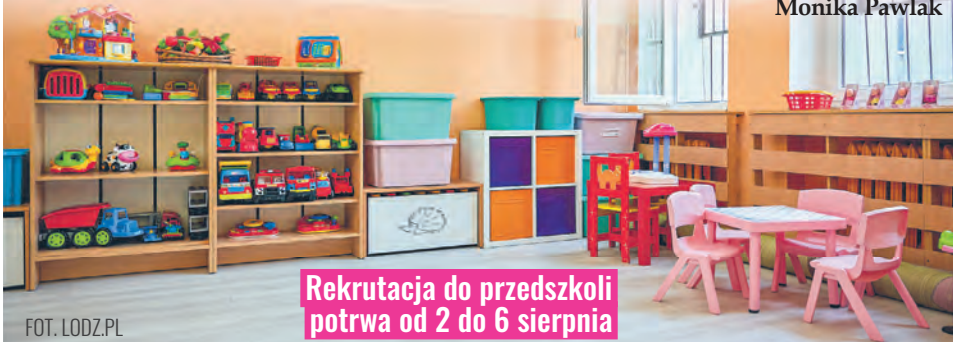
Rekrutacja do przedszkoli potrwa od 2 do 6 sierpnia