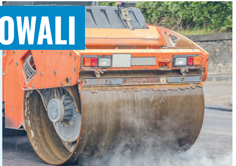
Między remontem Szczecińskiej a budową centrum na Olechowie była największa rywalizacja

Najbardziej zażyte głosowanie było w puli inwestycji bez ograniczeń kosztowych. Do samego końca łeb w łeb szły remont ulicy Szczecińskiej i budowa centrum rekreacyjno-kulturalnego na Olechowie. Zwyciężył pierwszy z projektów. W kolejnych kategoriach łodzianie wybrali remont ul. Pomorskiej i Biegańskiego. Projekty zostały już wpisane do budżetu miasta. Teraz czas na ruch po stronie rządu. rd