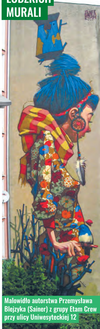
Malowidło autorstwa Przemysława Błejzka (Sainer) z grupy Etam Crew przy ulicy Uniwersyteckiej 12