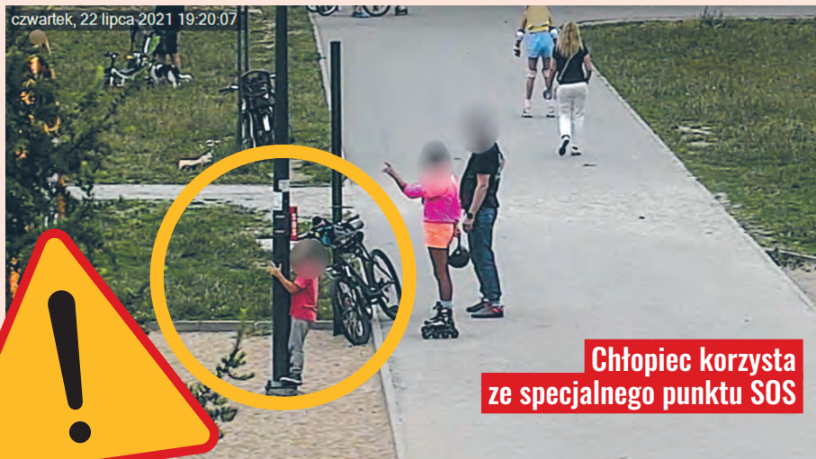
Chłopiec korzysta ze specjalnego punktu SOS

Młodzieniec wykazał się niezwykłą odpowiedzialnością, czym nie może się natomiast pochwalić 11-letnia łodzianka, która postanowiła na własną rękę odwiedzić... Czarnobyl. Wyszła na zakupy do pobliskiego sklepu, a gdy przez kilka godzin nie wracała, mama zaalarmowała policję. Okazało się, że dziewczynka taksówką pojechała na dworzec