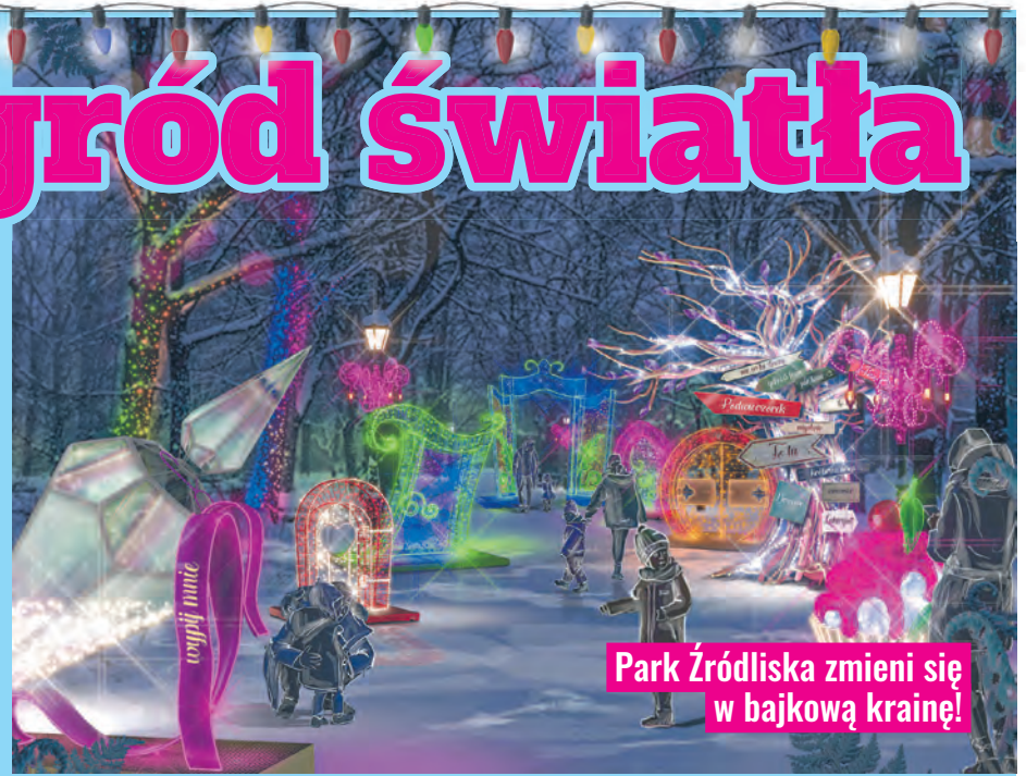
Park Źródlika zmieni się w bajkową krainę!