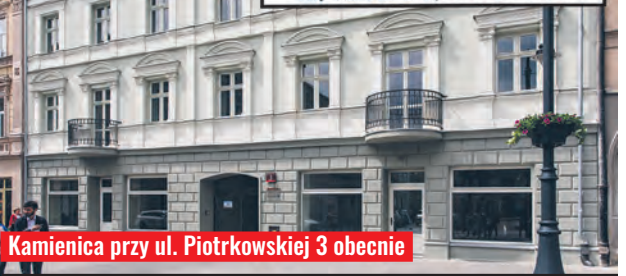
Kamienica przy ul. Piotrkowskiej 3 obecnie

HOTEL POLSKI w Łodzi, ulica Piotrkowska Nr. 3rd, POKOJE NUMEROWANE w salonie od 1 r. – 5 r., 50 zł. Omalutka hotelowy do dworca kolej. Przy hotelu restauracja C. F. KLUKOWA.