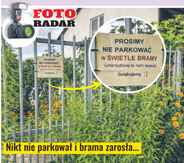
Nikt nie parkował i brama zarosła...