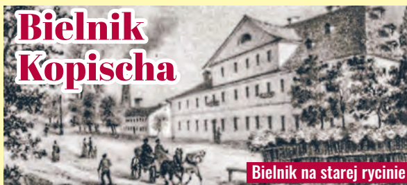
Bielnik na starej rycinie