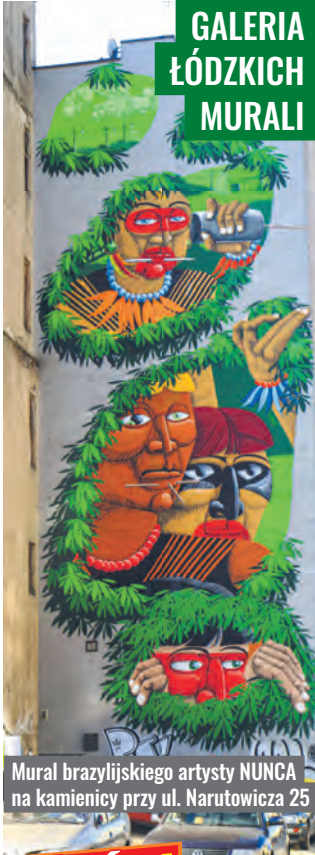
Mural brazylijskiego artysty NUNCA na kamienicy przy ul. Narutowicza 25

ŁÓDŹ.pl Kolejne wydanie w poniedziałek 16 sierpnia