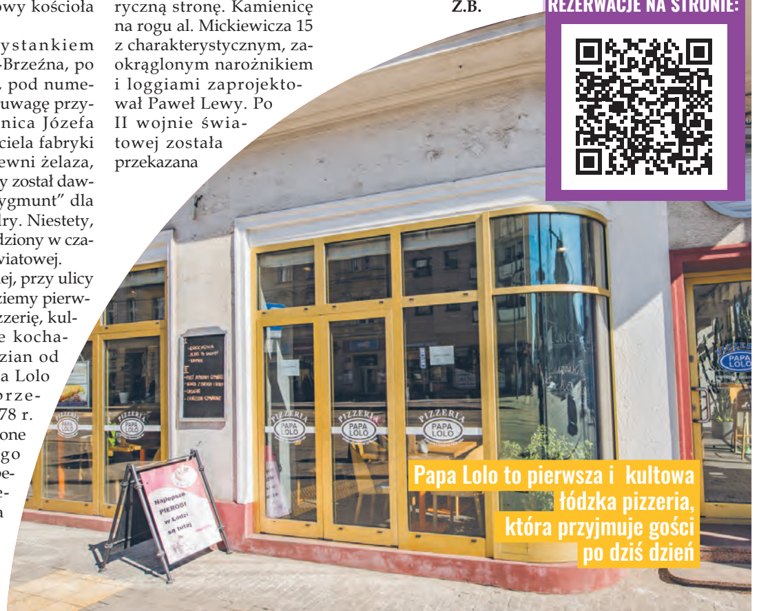
Papa Lolo to pierwsza i kultowa łódzka pizzeria, która przyjmuje gości po dziś dzień

WYCIECZKI: I tura: godz. 12:00–14:30 II tura: godz. 15:00–17:30 Koszt wycieczki: 20 zł