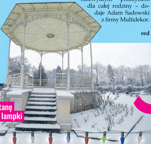
Tej zimy parkową altanę rozświetlą kolorowe lampki