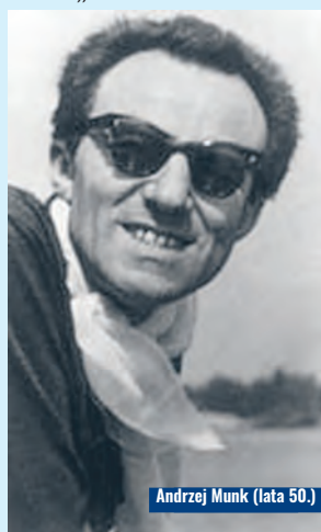
Andrzej Munk (lata 50.)

W 1956 r. nakręcił pierwszy film polski podejmujący rozrachunek z okresem stalinizmu „Człowiek na torze”.