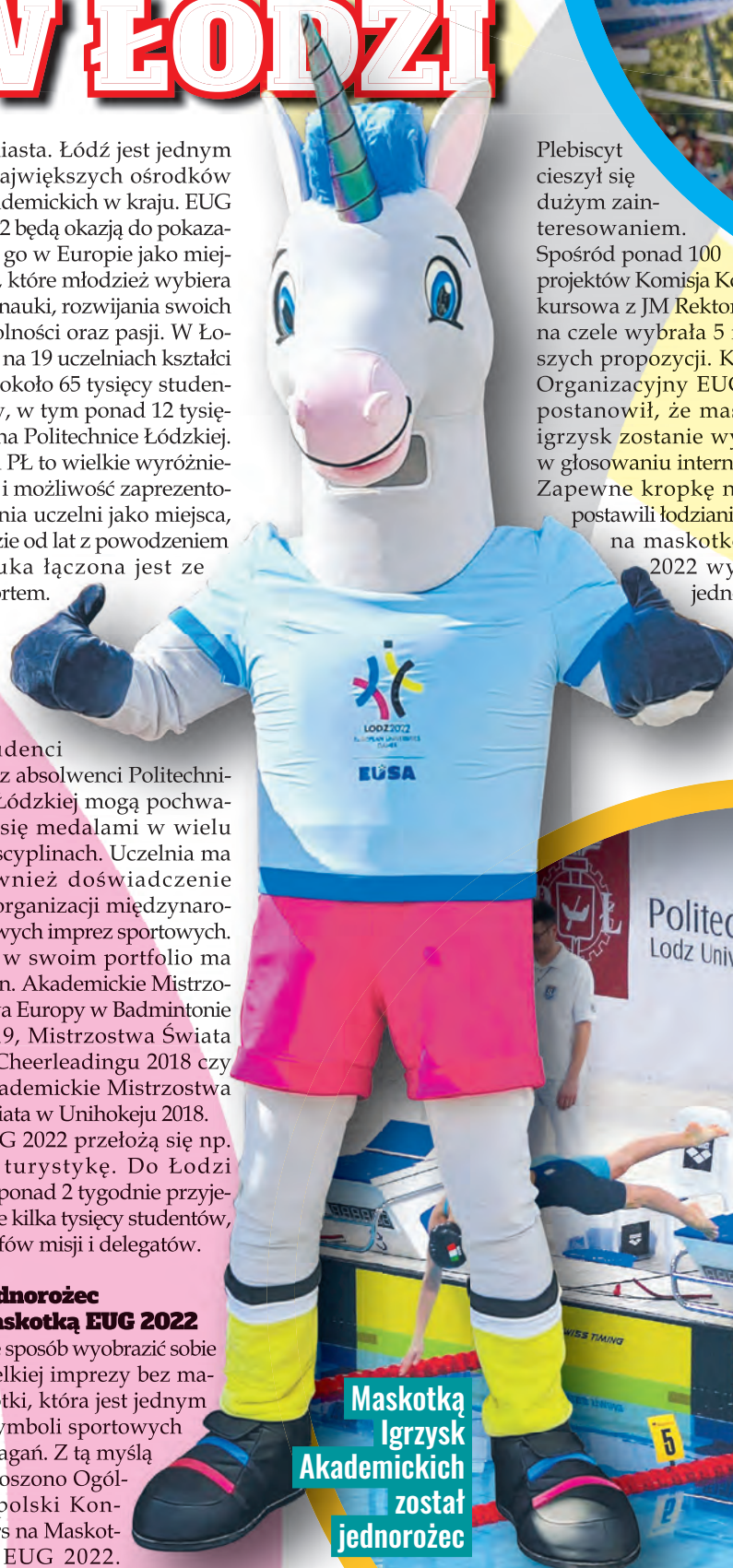
Maskotką Igrzysk Akademickich został jednorożec

Nie sposób wyobrazić sobie wielkiej imprezy bez maskotki, która jest jednym z symboli sportowych zmagania. Z tą myślą ogłoszono Ogólnopolski Konkurs na Maskotkę EUG 2022.