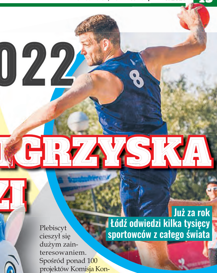
Już za rok Łódź odwiedzi kilka tysięcy sportowców z całego świata

Plebiscyt cieszył się dużym zainteresowaniem. Spośród ponad 100 projektów Komisja Konkursowa z JM Rektorem PŁ na czele wybrała 5 najlepszych propozycji. Komitet Organizacyjny EUG 2022 postanowił, że maskotka igrzysk zostanie wybrana w głosowaniu internautów. Zapewne kropkę nad „i” postawili łodzianie, gdyż na maskotkę EUG 2022 wybrano jednorożca, który