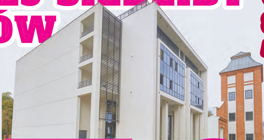
Sercem „Alchemium” jest centrum konferencyjne, którego PŁ bardzo brakowało