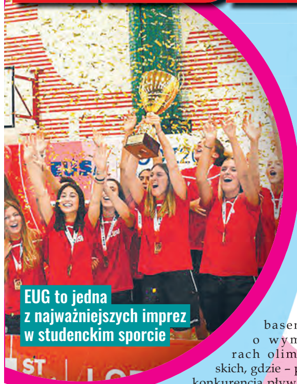
EUG to jedna z najważniejszych imprez w studenckim sporcie

Europejskie Igrzyska Akademickie (European Universities Games - EUG) to organizowana co 2 lata w różnych miastach największa impreza sportu akademickiego na Starym Kontynencie. Wyboru Łodzi jako organizatora VI edycji EUG dokonano w Madrycie podczas wielkiego zgromadzenia EUSA - Europejskiej Federacji Sportu Akademickiego, pod której sztandarem odbędą się łódzkie igrzyska. Wyzwań sportowych podczas EUG 2022 nie zabraknie. Studenci-sportowcy będą rywalizować w 15 konkurencjach. W programie igrzysk są także dyscypliny jak siatkówka, siatkówka plażowa, koszykówka 3x3, badminton, piłka nożna, futsal, tenis, piłka ręczna, piłka ręczna plażowa, tenis stołowy oraz paratenis stołowy. Arenami igrzysk będą łódzkie obiekty sportowe. Część zawodów zaplanowano w Zatoce Sportu Politechniki Łódzkiej, która dysponuje jedynym w województwie krytym