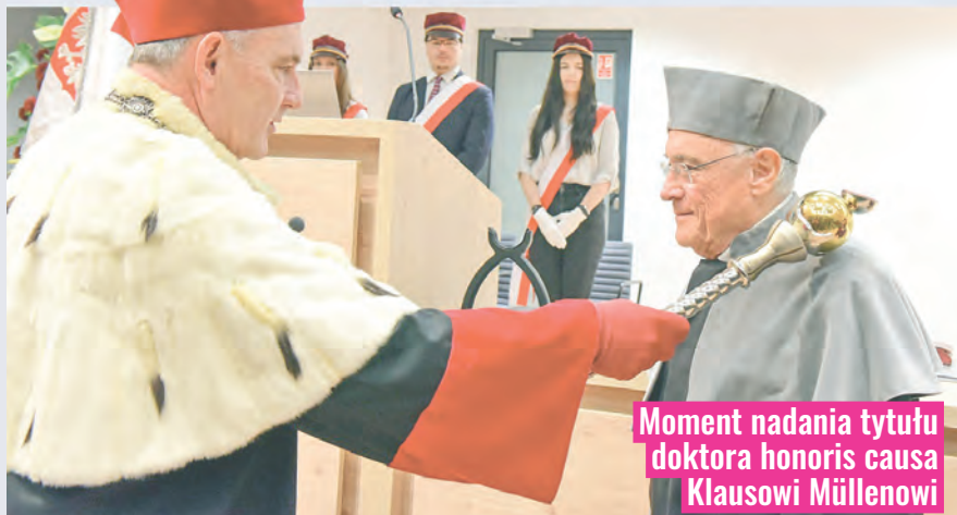
Moment nadania tytułu doktora honoris causa Klausowi Müllenowi