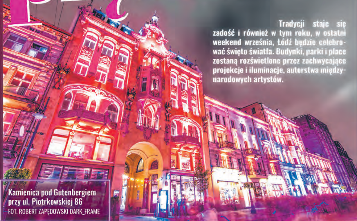
Kamienica pod Gutenbergiem przy ul. Piotrkowskiej 86

Tradycji staje się zadość i również w tym roku, w ostatni weekend września, Łódź będzie celebrować święto światła. Budynki, parki i place zostaną rozświetlone przez zachwycające projekcje i iluminacje, autorstwa międzynarodowych artystów.