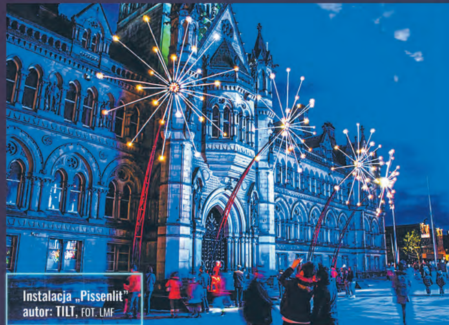
Instalacja „Pissenlit” autor: TILT

nowite widowisko, łączące światło, kolor, dźwięk i taniec. Zobaczymy mapping na kościele św. Teresy, stworzony przez francuskie artystki, wzbogacony o spektakl taneczny na żywo – mówi Beata Konieczniak, Dyrektor Artystyczna Light.Move.Festival. Festiwal Sztuki Kinetycznej Światła odbywać się będzie również w obszarze Nowego Centrum Łodzi, w parku im. Sienkiewicza, parku im. Staszica, a także tradycyjnie rozświetli kamienice i skwery ul. Piotrkowskiej. Tematem przewodnim