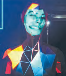
Instalacja interaktywna „Face”, autor: Thomas Voilleaume

tegorocznej edycji są Połączenia. LMF 2021 chce eksplorować zagadnienie miejsca człowieka w nowoczesnym świecie oraz więzach i relacjach, jakie rozwija, zarówno z innymi ludźmi, jak i środowiskiem, przestrzenią i światem cyfrowym. – Dlatego też inaugurujemy nowe kategorie festiwalu: LMF EDU (gdzie