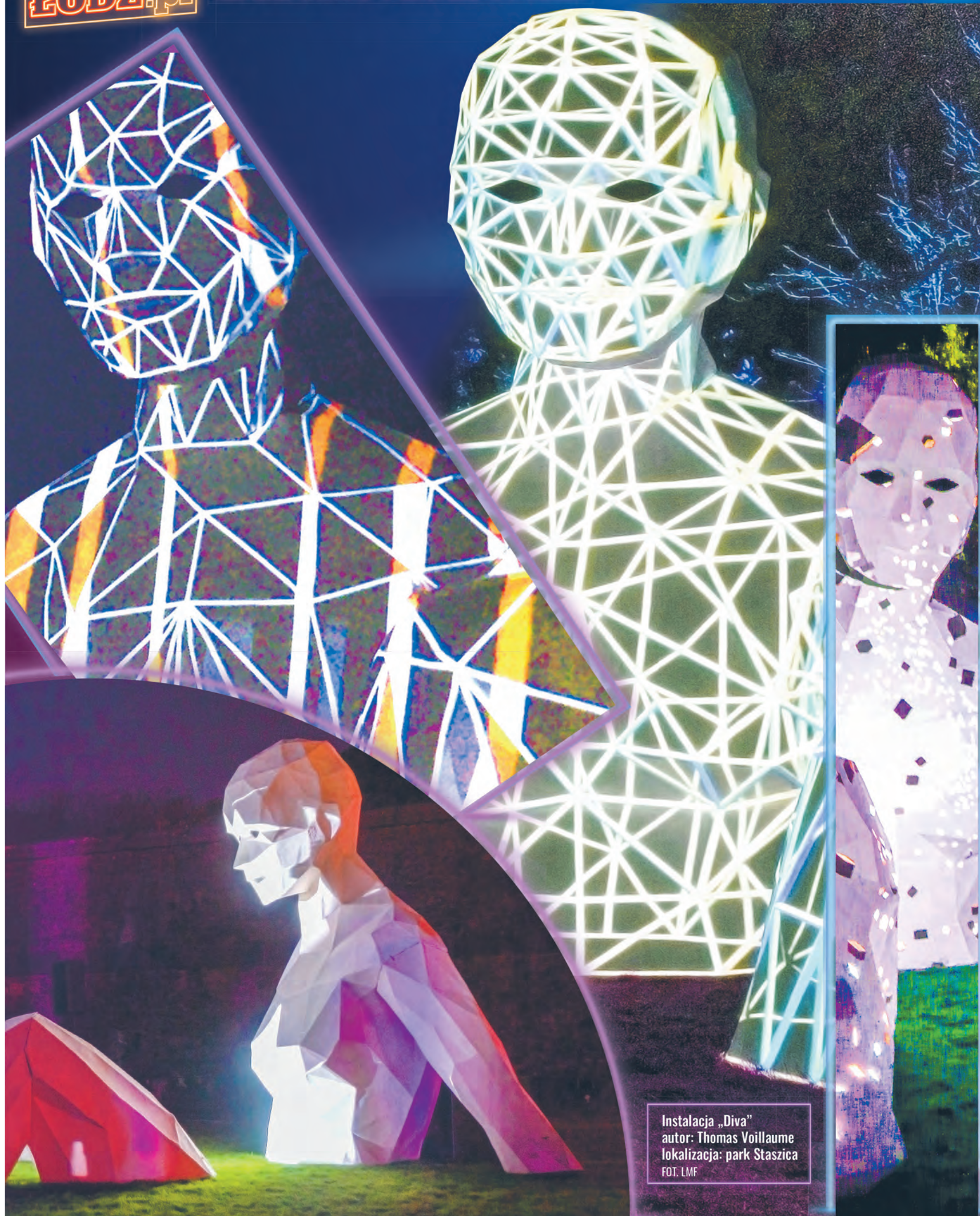
Instalacja „Diva” autor: Thomas Voillaume lokalizacja: park Staszica