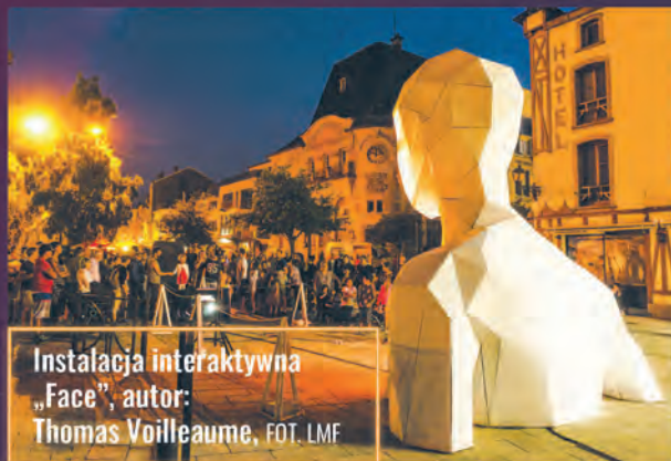
Instalacja interaktywna „Face”, autor: Thomas Voilleaume

Tegoroczna edycja Festiwalu Kinetycznej Sztuki Światła nie będzie kierować się jedynie tradycją, ale poszuka też nowatorskich rozwiązań, nawiązujących do obecnej sytuacji na świecie. Czas pandemii paradoksalnie stał się dla organizatorów festiwalu źródłem wiedzy i inspiracji. W trosce o bezpieczeństwo widzów teren festiwalowy jest w tym roku bardziej rozległy niż w poprzednich latach, nadal jednak skupia się na Śródmieściu. Dodatkowo część atrakcji programowych będzie relacjonowana online. W tym roku gościć bę-