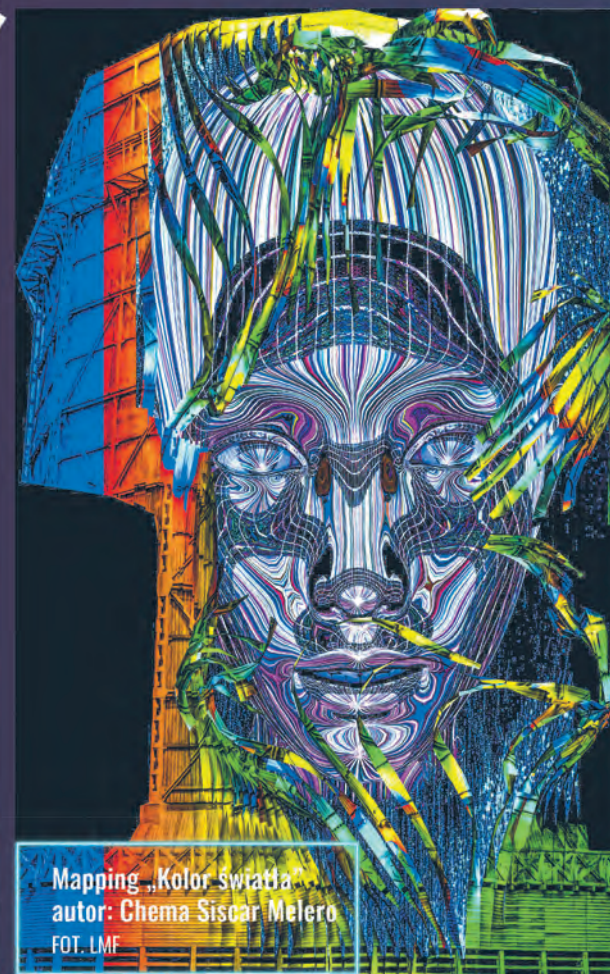
Mapping „Kolor światła” autor: Chema Siscar Melero

Tradycji staje się zadość i również w tym roku, w ostatni weekend września, Łódź będzie celebrować święto światła. Budynki, parki i place zostaną rozświetlone przez zachwycające projekcje i iluminacje, autorstwa międzynarodowych artystów.