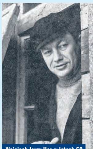
Wojciech Jerzy Has w latach 60.

m.in. „Rękopis znaleziony w Saragossie” (1964, według Jana Potockiego), „Lalka” według B. Prusa (1968)