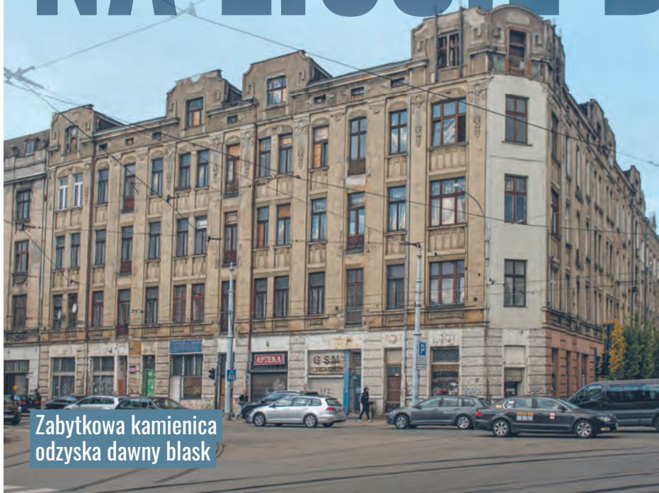
Zabytkowa kamienica odzyska dawny blask

Narozny budynek przy skrzyżowaniu ul. Gdańskiej z Legionów ma szansę na remont w ramach programu rewitalizacji. Byłoby to idealne uzupełnienie odnowy tej części Łodzi.