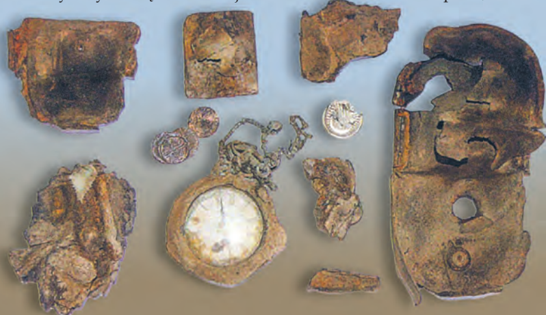
Zdjęcia z wykopalisk oraz fotografie zidentyfikowanych ofiar pochodzą z wydawnictwa UMŁ, UŁ i SNAP „Nekropolia z terenu byłego poligonu wojskowego na Brusie w Łodzi. Mogiła ekshumowana w 2008 r.”