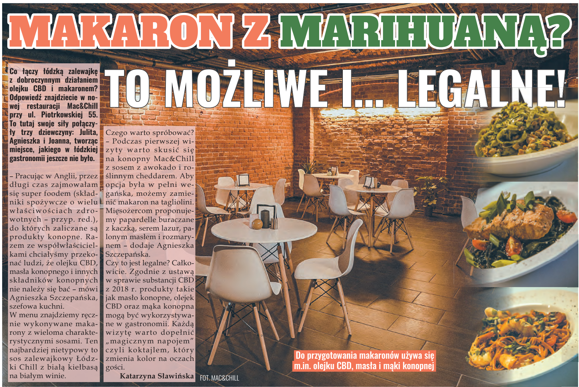
Do przygotowania makaronów używa się m.in. olejku CBD, masła i mąki konopnej