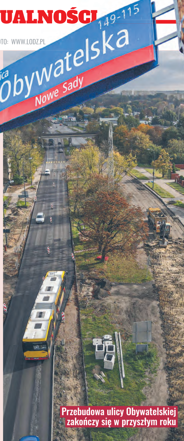
Przebudowa ulicy Obywatelskiej zakończy się w przyszłym roku