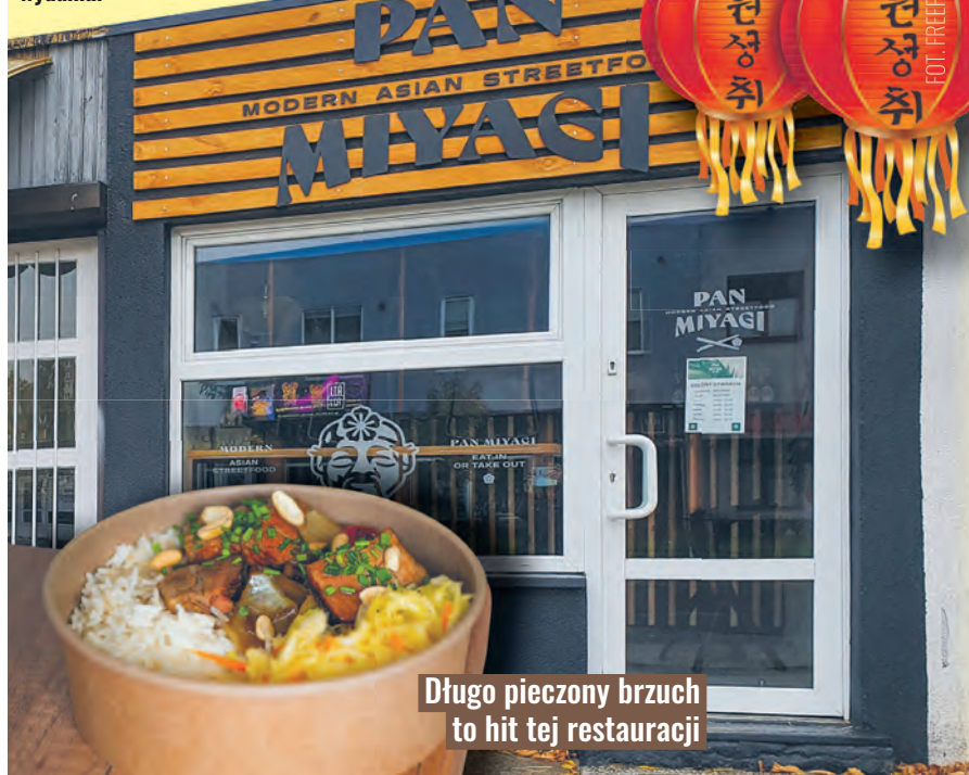
Długo pieczony brzuch to hit tej restauracji

Niech was nie zmyli widok małej budki przy ul. Tatrzańskiej 78, w środku znajdziecie kuchnię na wysokim poziomie. Pan Miyagi serwuje tu azjatycki street food w najlepszym wydaniu.