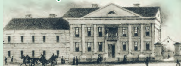
Ilustracja z książki - Zakład Fabryczny Feslera

Ukończył gimnazjum w Piotrkowie Trybunalskim i wybrał karierę urzędnika gubernialnego w Warszawie, a potem był zarządcą na kolei. Oskar Flatt poza pracą zawodową był przede wszystkim