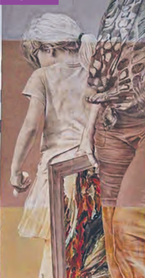
Mural autorstwa Guido van Heltena na wieżowcu przy ulicy Morcinka 2