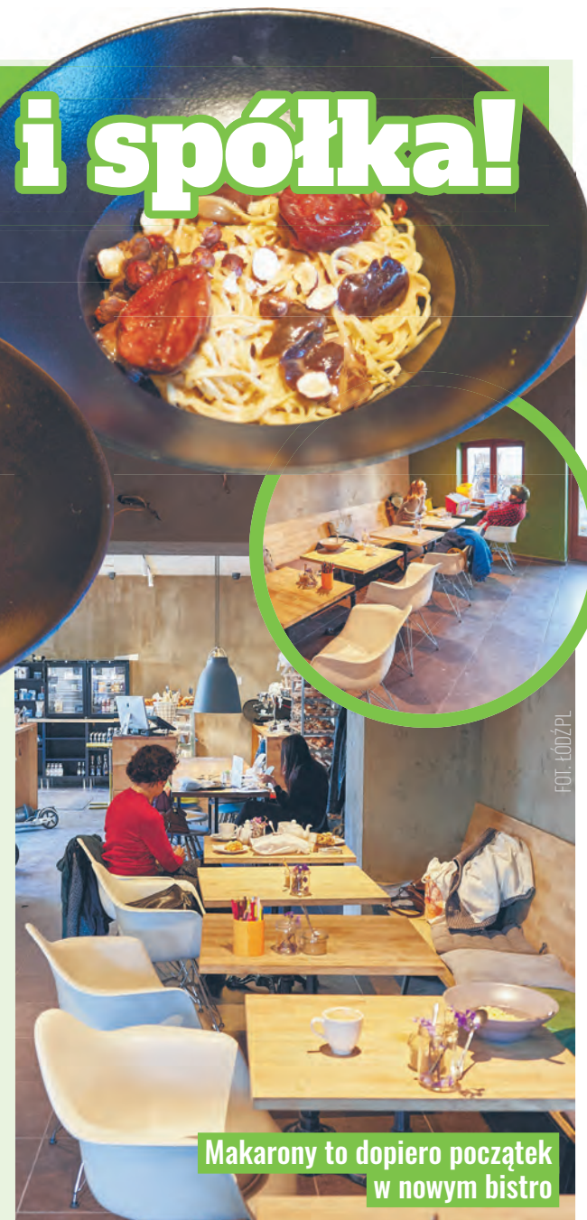
Makarony to dopiero początek w nowym bistro