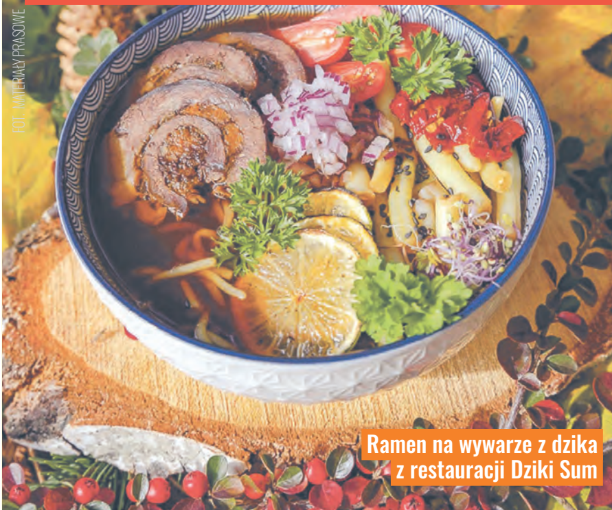
Ramen na wywarze z dzika z restauracji Dzikie Sum

Listopad to idealny czas na próbowanie rozgrzewających zup. Rozpoczynający się już w piątek (5 listopada) Ramen Festival, organizowany przez Jemy w Łodzi, to ku temu najlepsza okazja. 35 restauracji i aż 10 dni, aby odwiedzić je wszystkie!