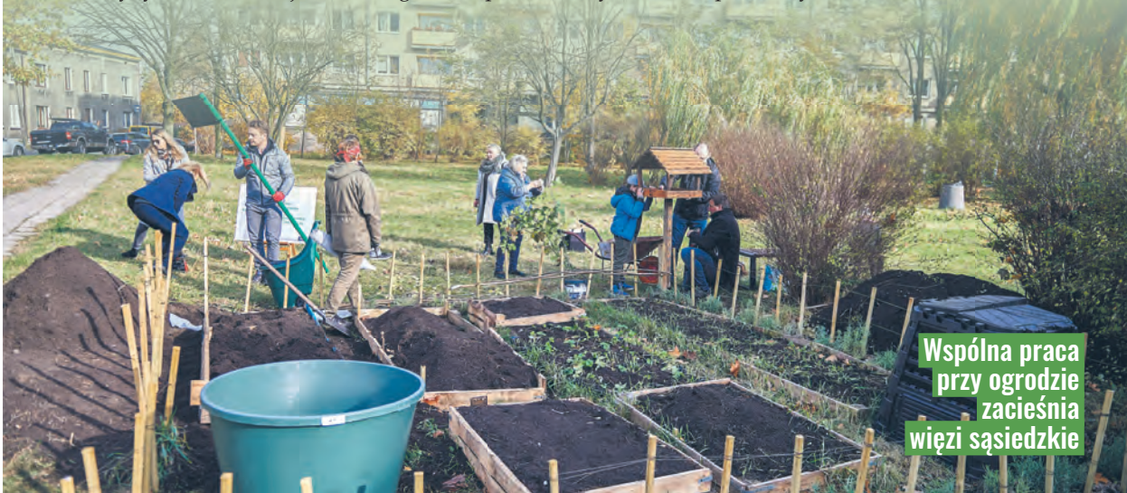
Wspólna praca przy ogrodzie zacieśnia więzi sąsiedzkie