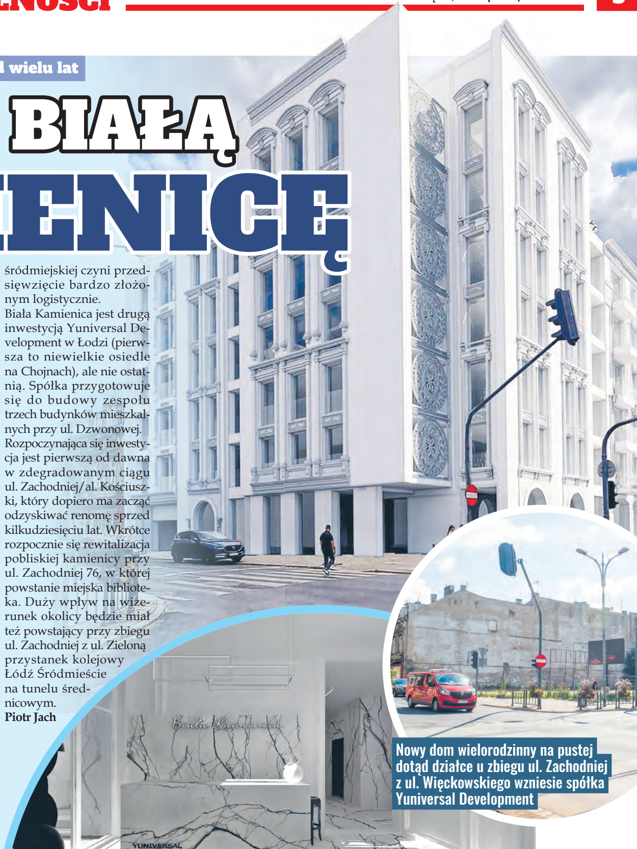
Nowy dom wielorodzinny na pustej dotąd działce u zbiegu ul. Zachodniej z ul. Więckowskiego wzniesie spółka Universal Development