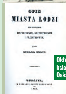
Oktładka książki Oskara Flatta

zapałonym krajoznawcą, dziennikarzem, literatem i krytykiem, badaczem folkloru i publicystą ekonomicznym, współpracownikiem „Gazety Codziennej”, gdzie zamieszczał swoje felietony z licznych podró-