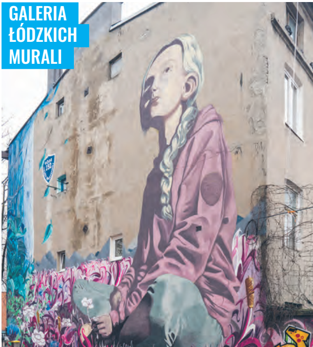
Mural „Dziewczyna w ogrodzie” przy Szkole Podstawowej nr 152 (ul. 28 Pułku Strzelców Kaniowskich) autorstwa Art Open Studio