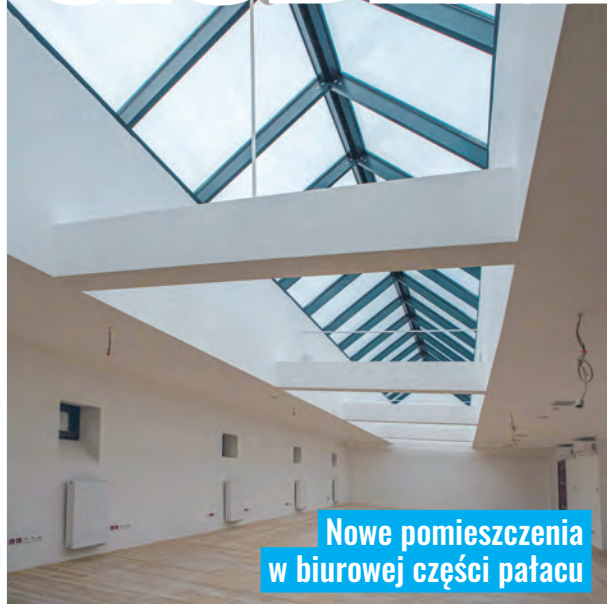
Nowe pomieszczenia w biurowej części pałacu