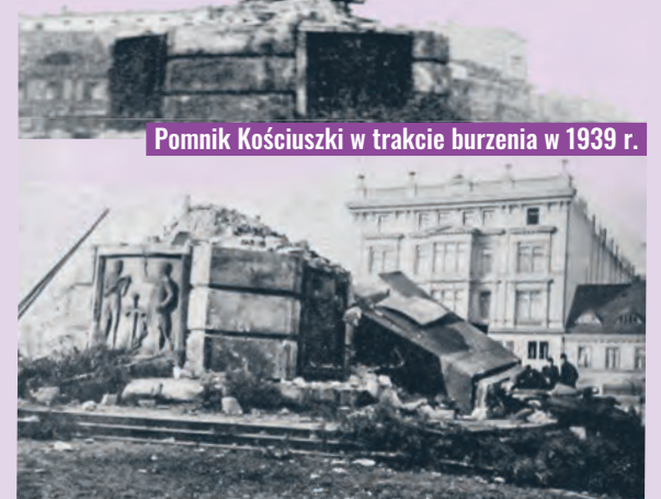
Pomnik Kościuszki w trakcie burzenia w 1939 r.

Kościuszki odbyło się 21 VII 1960 r., czyli przez 20 lat na pl. Wolności nie było jednego z charakterystycznych symboli Łodzi, o czym już nie pamiętamy. agr