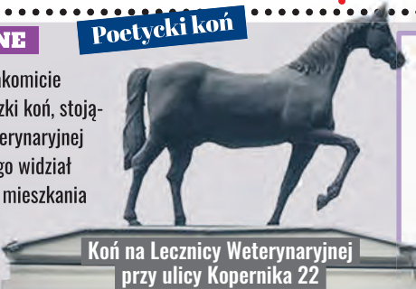
Koń na Lecznicy Weterynaryjnej przy ulicy Kopernika 22

Było to w pierwsze dni smętnienia, Za miłosego bezkrólewia, W czas ewangelii, czas Szopena I - KONIA, co na dachu rdzewiał. Tak. Z okna widać było konia Metalowego. Stał bez jeźdźca I dawno nęcił mnie, walkonia, By wskoczyć - i galopem z miejsca