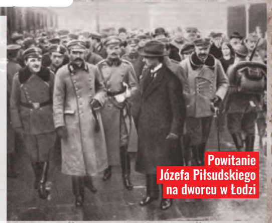
Powitanie Józefa Piłsudskiego na dworcu w Łodzi

Następnego dnia miasto ogarała szala radości. Prawie cała polska ludność wyległa na place i ulice. Grupy młodzieży zrzuciły niemieckie szлды i godła państwowe. W oknach i na balkonach pojawiły się polskie barwy narodowe. Mglistym rankiem nad miastem powiewały już biało-czerwone flagi. Władza znalazła się w rękach magistratu, a nadburmistrz Leopold Skulski przystąpił do organizowania milicji miejskiej pod komendą gen. S. Suryń-Masalskiego. Ostatni żołnierze niemieccy opuścili Łódź 20 listopada... agr