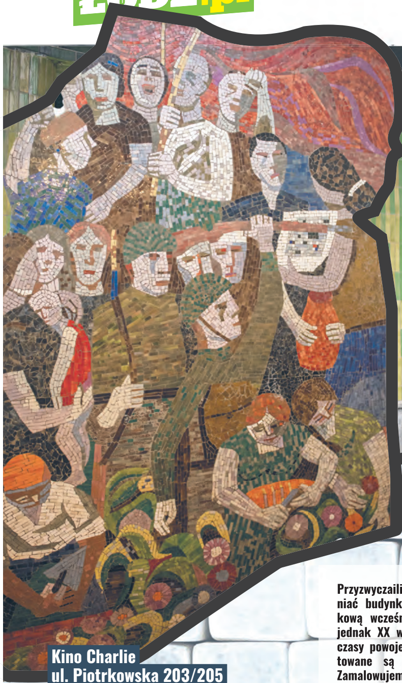
Kino Charlie ul. Piotrkowska 203/205