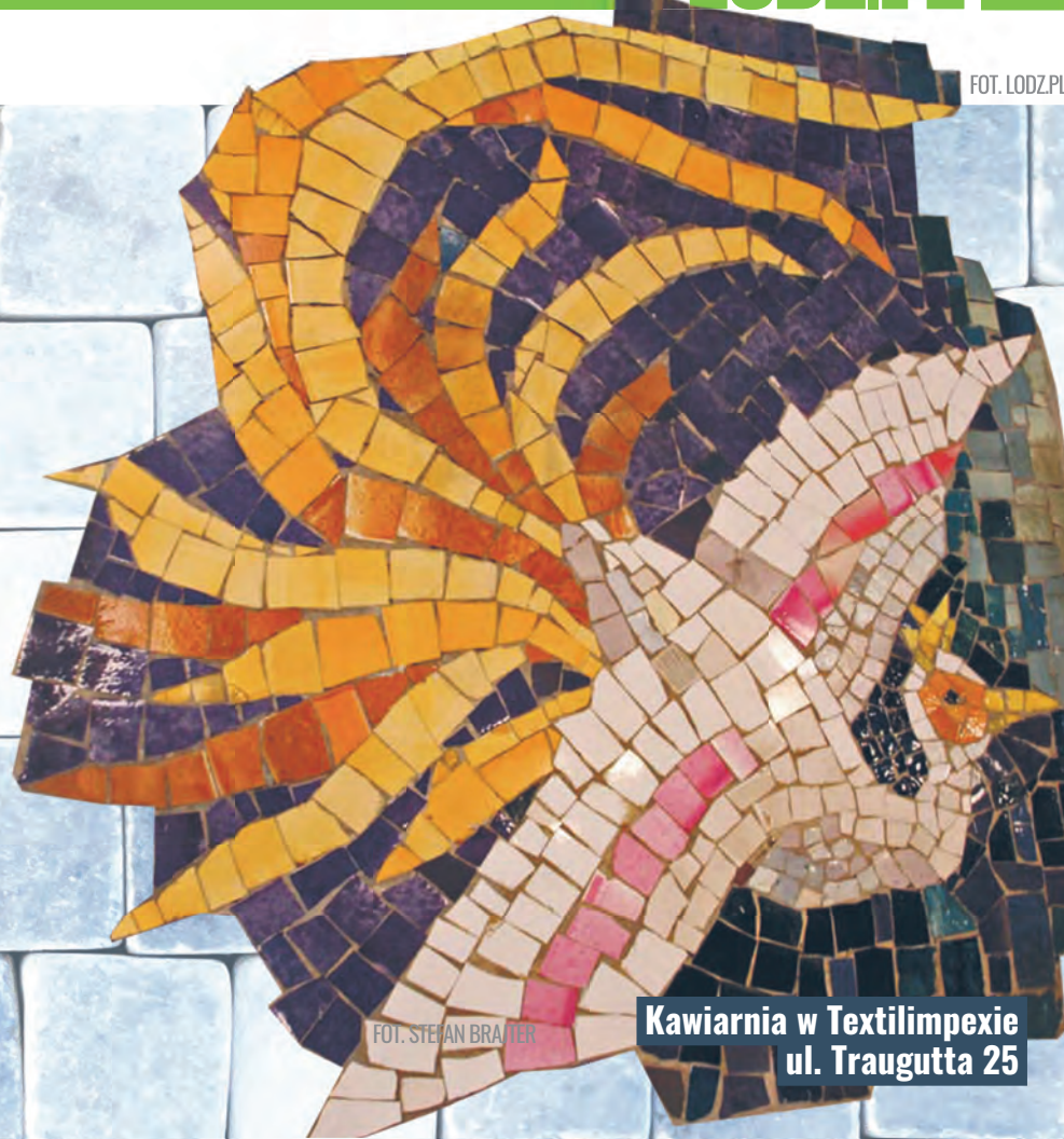
Kawiarnia w Textilimpexie ul. Traugutta 25