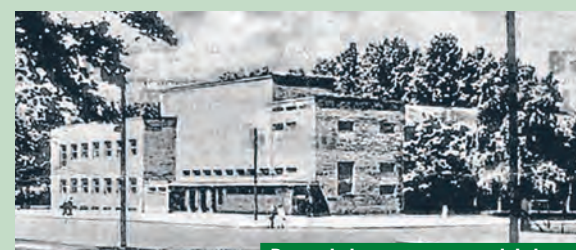
Dawna hala sportowa przy ul. Łąkowej

dawnej WFF przy ulicy Łąkowej 29 pozostały jedynie ślady dawnej Łodzi filmowej: Toya, Klub Wytwórnia, Opus Film, Oddział Filмотeki Narodowej oraz w pobliżu hotel, na elewacji którego z daleka spoziera kadr „Zakazanych piosenek”... agr