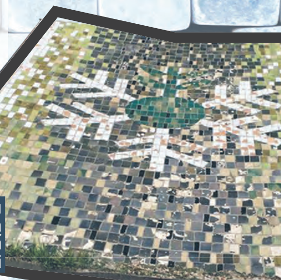
Mozaika z Hortexu trafi na wystawę stałą do Centralnego Muzeum Włókiennictwa w Łodzi