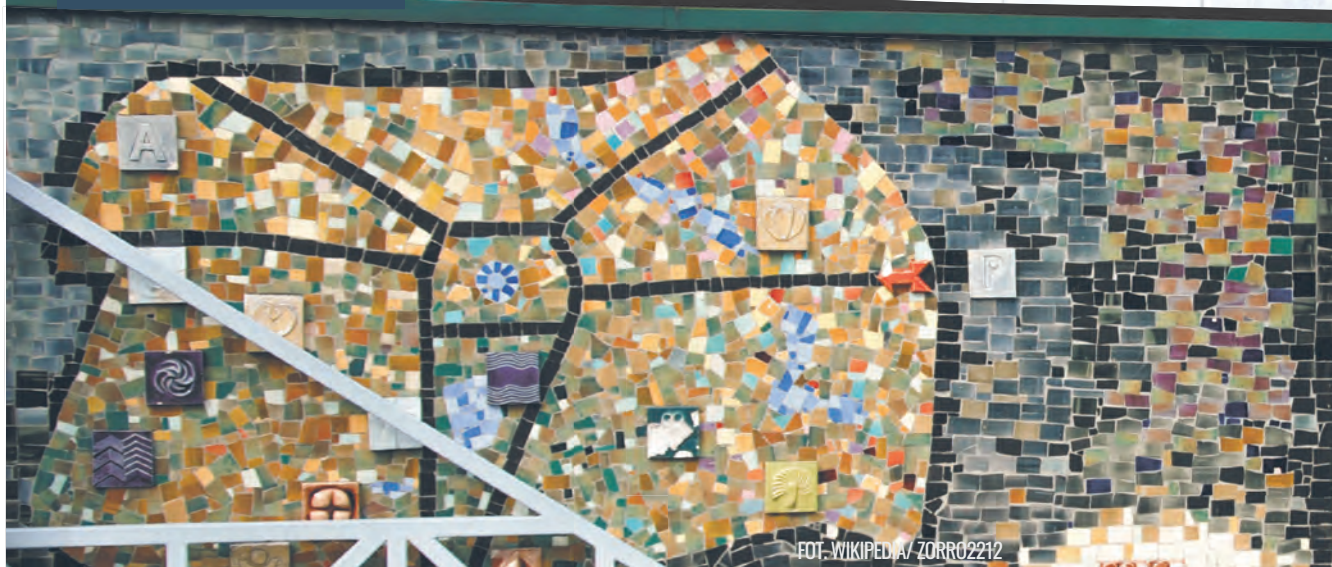
Łódzki Ogród Botaniczny ul. Krzemieniecka 36/38

szkolenia partyjne i pokazy cenzorskie, a gdy patrzy się na mozaikę, ducha tamtych czasów czuć wyraźnie także dzisiaj. Czerwone flagi powiewają nad zgromadzonym tłumem – są tu uzbrojeni żołnierze i zajęci pracą robotnicy, jest trzymająca dziecko w ramionach Matka Polka. Symboliczny charakter ma także ceramiczny obraz znajdujący się nad wejściem do siedziby Wydziału Farmaceutycznego UM (ul. Muszyńskiego 1). Budynek powstał w latach 60. jako część Dzielniccy Wyższych Uczelni, mającej stanowić wspólny kompleks Uniwersytetu Łódzkiego i Akademii Medycznej. Mozaika czytelnie nawiązuje do