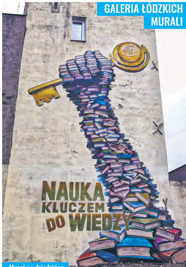
Mural na dziedzińcu Wydziału Ekonomiczno-Socjologicznego Uniwersytetu Łódzkiego (ul. Rewolucji 39/41). Autor - Barys (Marcin Barjasz)