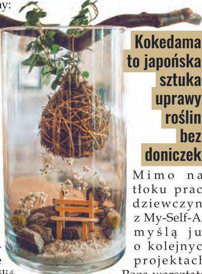
Agnieszka, Oliwkę i Olę połączyła pasja do piękna i natury

– To będzie seria zajęć artystycznych, w czasie których najmłodszy samodzielnie lub pod opieką dorosłych stworzą dekorację do swojego pokoju – zapowiada Agnieszka.