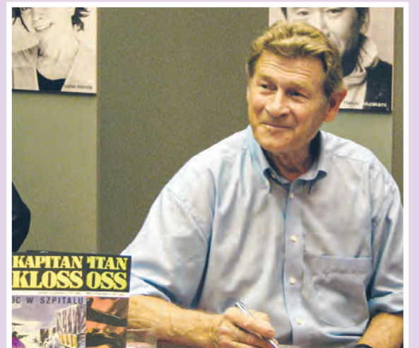
53. Międzynarodowe Targi Książki w Warszawie - Stanisław Mikulski podpisuje komiksy „Kapitan Kloss” (2008).

Zmarł w wyniku choroby nowotworowej i 5 grudnia 2014 roku został pochowany w Alei Zasłużonych na Cmentarzu Wojskowym na Powązkach. agr