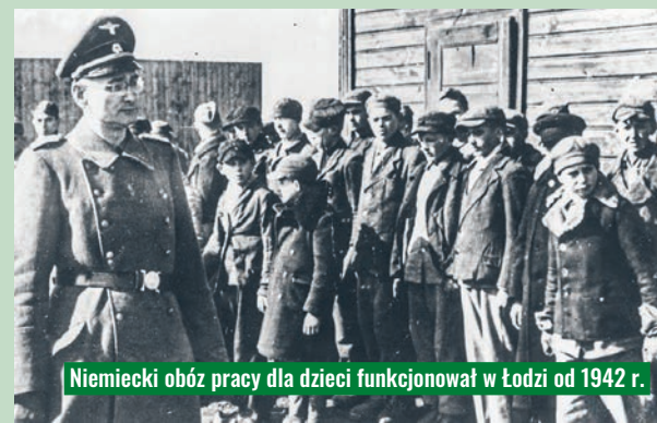
Niemiecki obóz pracy dla dzieci funkcjonował w Łodzi od 1942 r.