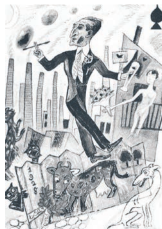
Julian Tuwim w karykaturze Władysława Dąbowskiego w „Wiadomościach Literackich” z 1928 roku.