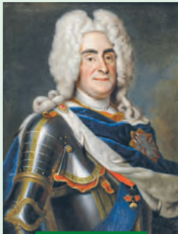
August III Mocny

W 1623 r. było już jednak ok. 120 domostw, czyli ponad 600 mieszkańców. Tymczasem dotarł do Łodzi najazd Szwedów i w latach 1660-1665 wyłudnił miasto. Część miesz-