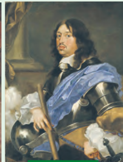
Karol X Gustaw

kańców uciekła przed wojskami, część zginęła, a zabudowania zostały splądrowane i spalone. Rokosz Lubomirskiego powoduje ponowne złupienie, z którego Łódź nie