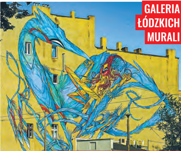
Mural na budynku przy ul. Wojska Polskiego 82 autorstwa polsko-australijskiego artysty o pseudonimie Shida