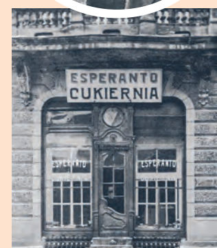
Cukiernia „Esperanto” na parterze kamienicy przy ul. Sienkiewicza 4