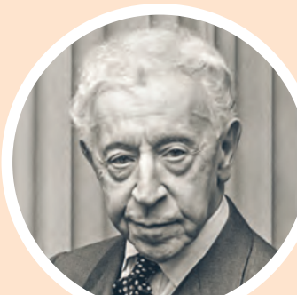
Artur Rubinstein w 1971 r.