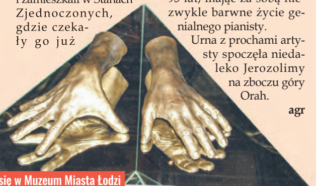
Odlew dłoni pianisty znajduje się w Muzeum Miasta Łodzi