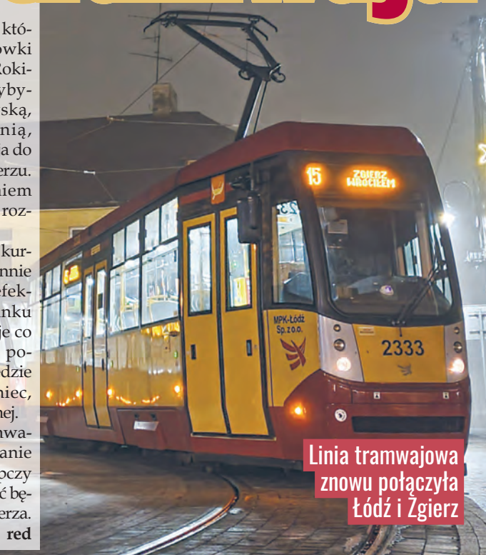
Linia tramwajowa znowu połączyła Łódź i Zgierz

W dni robocze obie linie kursować będą naprzemiennie co kwadrans, a to w efekcie na wspólnym odcinku trasy zapewni tramwaje co 7,5 min. Siódemka od poniedziałku kursować będzie z Widzewa na Żabieniec, a nie do pętli na Północnej. Wraz z powrotem tramwajów do Zgierza przestanie kursować autobus zastępczy Z45, a linia Z46 kursować będzie z Ozorkowa do Zgierza.