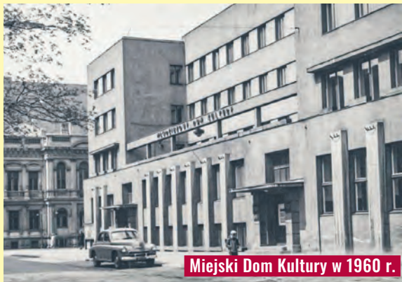
Miejski Dom Kultury w 1960 r.

który od 1964 roku nosił nazwę – Pałac Młodzieży im. Juliana Tuwima. W skrócie mówiono zwykle na ten obiekt „emdek”, a był tam m.in. Teatr Rozmaitości, kryty basen oraz liczne pracownie artystyczne i sale do zajęć sportowych. Mówiąc o spotkaniu koło „emdeku”, większość Łodzian pomyśli raczej o przestrzeni pomiędzy ulicami Moniuszki i Traugutta, choć obecnie Pałac Młodzieży im. J. Tuwima, który kontynuuje dawną działalność edukacyjną