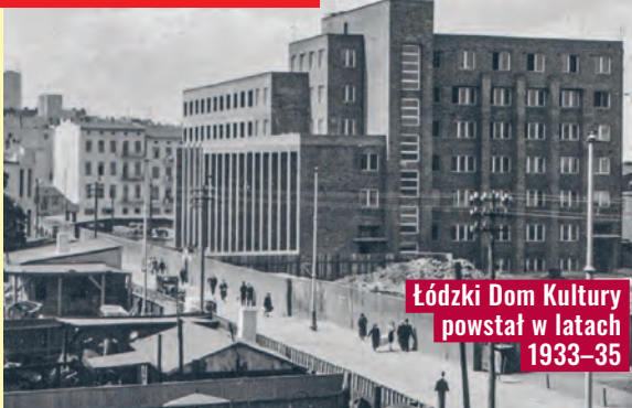
Łódzki Dom Kultury powstał w latach 1933–35