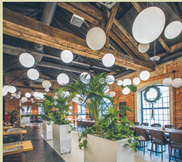
Restauracja działa w Ogrodach Geyera przy ul. Piotrkowskiej 295/305