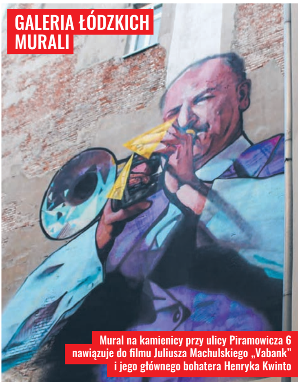
Mural na kamienicy przy ulicy Piramowicza 6 nawiązuje do filmu Juliusza Machulskiego „Vabank” i jego głównego bohatera Henryka Kwinto

ŁÓDŹ.pl DLA SENIORA | DLA RODZIN | DLA KOCHAJĄCYCH ŁÓDŹ