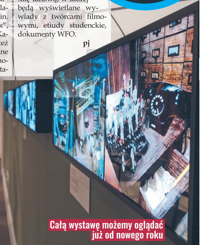
Całą wystawę możemy oglądać już od nowego roku