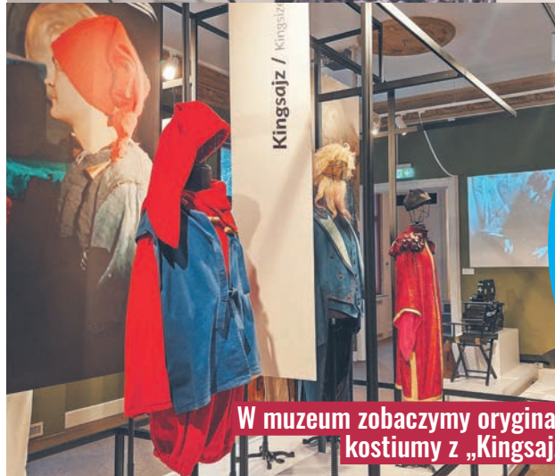
W muzeum zobaczymy oryginalne kostiumy z „Kingsajzu”