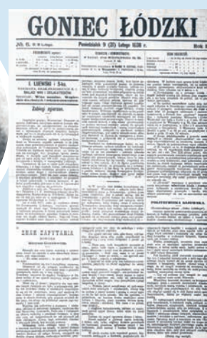
Okładka „Gonca Łódzkiego” z 1898 nr 6

lecz w stosunku do liczby mieszkańców Łodzi było to niewiele. Ceny gazet dla masowego czytelnika były zbyt wysokie. Abonament „Dziennika Łódzkiego” pod koniec XIX wieku wynosił 6 rubli, a „Łodzer Zeitung” – 8 rubli rocznie. W tym czasie robotnicy zarabiali 3–4 ruble tygodniowo. W 1906 r. „Goniec Łódzki” został zawieszony, a na jego miejsce pojawił się „Kurier Łódzki”, którego redakcja znajdowała się przy ulicy Zachodniej 37. agr