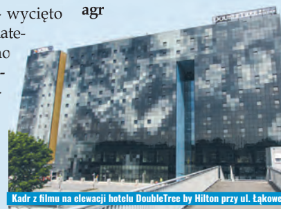
Kadr z filmu na elewacji hotelu DoubleTree by Hilton przy ul. Łąkowej

Widoczny z dalszej odległości kadr z „Zakazanych piosenek” zdobi obecnie elewację hotelu przy ulicy Łąkowej, przywołując także pamięć sławnej łódzkiej wytwórni. agr