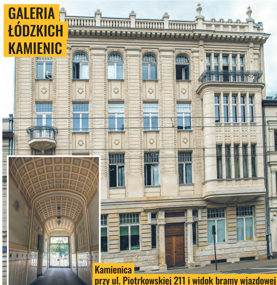
Kamienica przy ul. Piotrkowskiej 211 i widok bramy wjazdowej