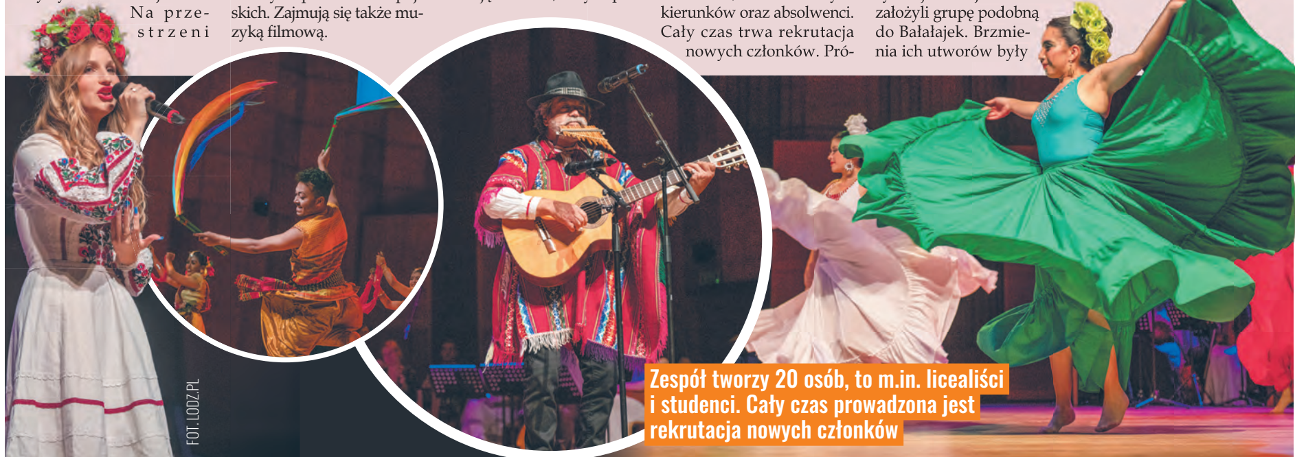
Zespół tworzy 20 osób, to m.in. licealiści i studenci. Cały czas prowadzona jest rekrutacja nowych członków