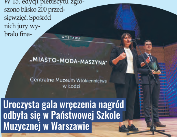
Uroczysta gala wręczenia nagród odbyła się w Państwowej Szkole Muzycznej w Warszawie