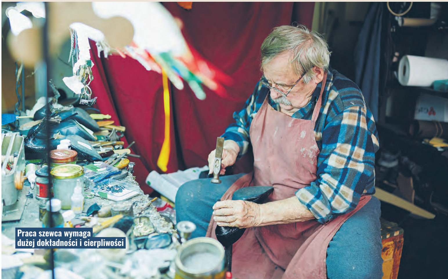
Praca szewca wymaga dużej dokładności i cierpliwości