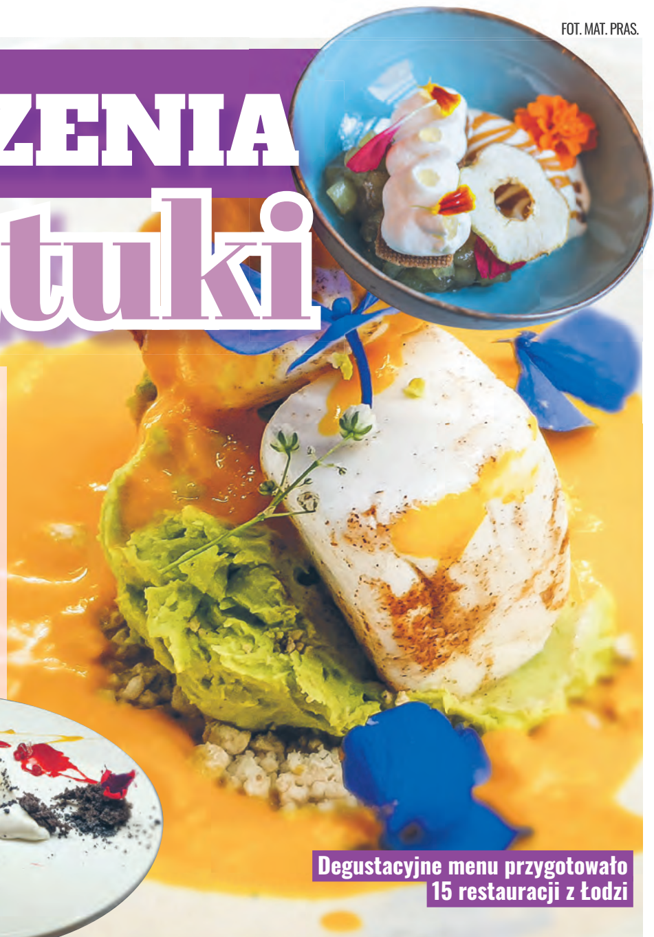
Degustacyjne menu przygotowało 15 restauracji z Łodzi