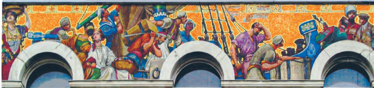
Mozaikowy fryz na fasadzie pałacu Juliusza Kindermanna przy ul. Piotrkowskiej 137/139, pochodzący z 1909 r.