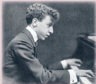
Artur Rubinstein w 1906 r.

Nawet najlepszy diament wymaga szlifowania. Pierwsze lekcje gry na fortepianie mały Artur pobierał u Adolfa Prechnera w Łodzi, a potem rodzice wysłali go do Warszawy, gdzie uczył się u Aleksandra Różyckiego.