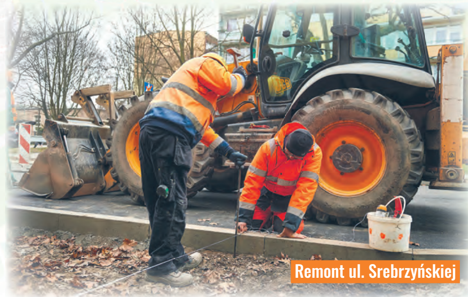
Remont ul. Srebrzyńskiej