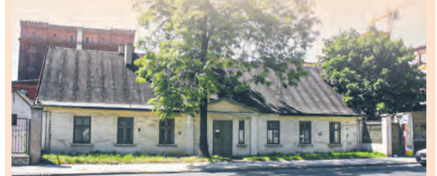
Dom Wendischa na Księżym Młynie