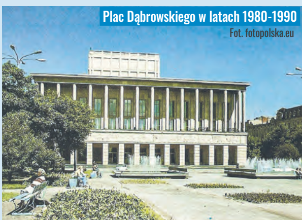
Plac Dąbrowskiego w latach 1980-1990

cegielnię, a dookoła pasły się kozy. Przez następną dekadę, aż do lat 20. XX w., pl. Dąbrowskiego pełnił ważne funkcje handlowe i nazywany był Targowym Rynkiem, na którym odbywały się także przedstawienia wędrownych cyrków. Specjalną drewnianą szopę, wybudowaną w tym celu, łodzianie rozebrali na opał w czasie I wojny światowej. W okresie międzywojennym stanął tu okazały gmach sądu, a po wojnie wzniesiono Teatr Wielki, którego budowa trwała 17 lat. Finalnie 19 stycznia 1967 r. została otwarta łódzka scena operowa. Przed gmachem trzy lata później trysnęła fontanna z kolorowymi światłkami, a teren placu był właściwie zielonym skwerem i miejscem spotkań. Nowy projekt nawiązuje do tej prostej koncepcji, a jakaś fontanna chyba zostanie.