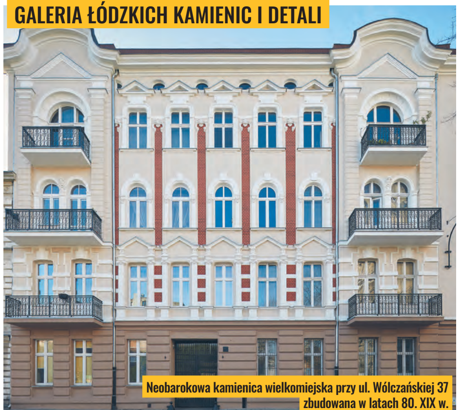
Neobarokowa kamienica wielkowiejska przy ul. Wólczańskiej 37 zbudowana w latach 80. XIX w.