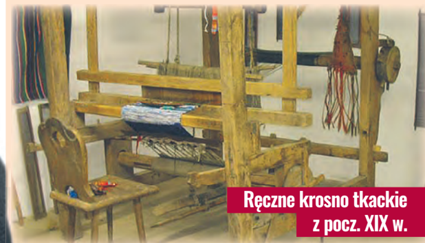
Ręczne krosno tkackie z pocz. XIX w.

Ogółem w trzech częściach osady Łódka wydzielono 167 działek budowlanych. Wszyscy przybyli z zagranicy osadnicy otrzymali od rządu po 1200 zł pożyczki, nieobarczonej żadnymi procentami na budowę domów murowanych, albo po 600 zł, jeśli budowali drewniak. Kapitał należało zwrócić po upływie 4 lat. Osadnicy, którzy nie budowali własnych siedzib, osiedlili się w budynkach municypalnych, a płacąc gotówką, stawali się ich właścicielami w ciągu 5 lat. agr