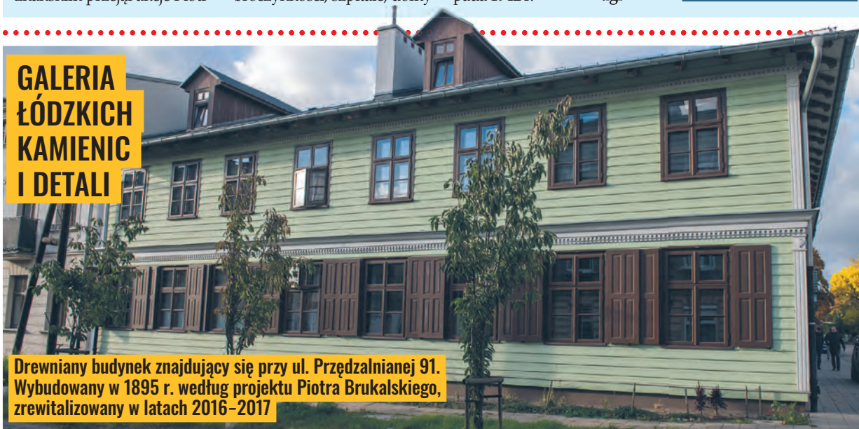
Drewniany budynek znajdujący się przy ul. Przędzalnianej 91. Wybudowany w 1895 r. według projektu Piotra Brukalskiego, zrewitalizowany w latach 2016–2017