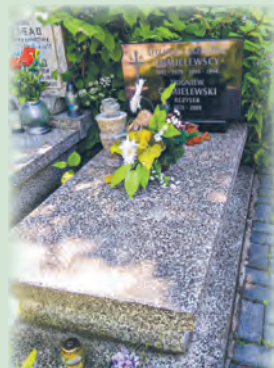
Grób Zbigniewa Chmielewskiego na Starym Cmentarzu w Łodzi

mi”, „Blisko, coraz bliżej”, a przede wszystkim, kręcony