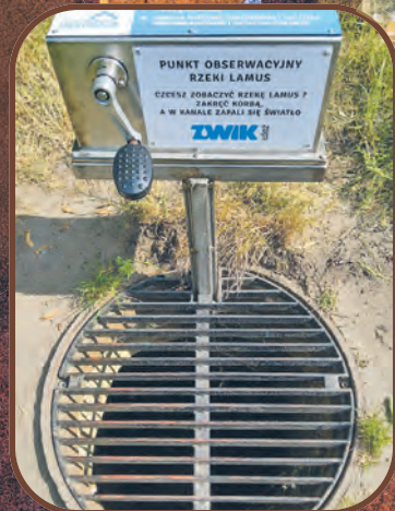
PUNKT OBSERWACYJNY RZEKI LAMUS CZESZĘ ZOBACZYĆ RZECĘ LAMUS I ZAPARK KOWAL, A W KANALE ZAPALI SIĘ ŚWIATŁO ZWIK