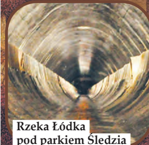
Rzeka Łódka pod parkiem Sledzia

W Łodzi nie zobaczymy też licznych, płynących pod centrum miasta rzeczek. Zakryto je w kolektorach 100 lat temu, gdyż stanowiły zagrożenie epidemiologiczne dla mieszkańców. Jasień, Łódkę,