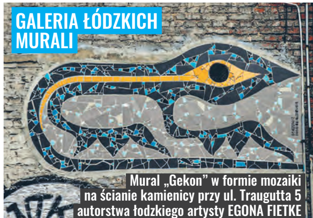
Mural „Gekon” w formie mozaiki na ścianie kamienicy przy ul. Traugutta 5 autorstwa łódzkiego artysty EGONA FIETKE