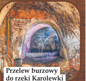
Przelew burzowy do rzeki Karolewki