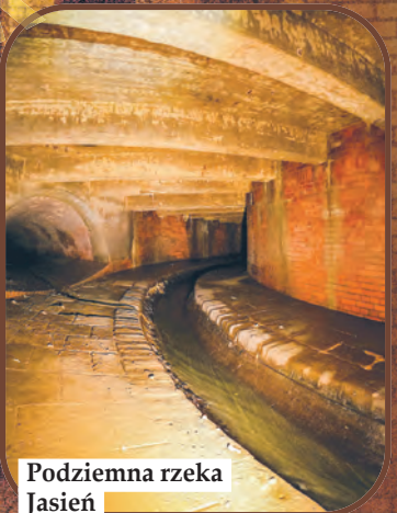
Podziemna rzeka Jasień