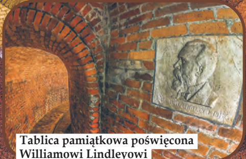
Tablica pamiątkowa poświęcona Williamowi Lindleyowi