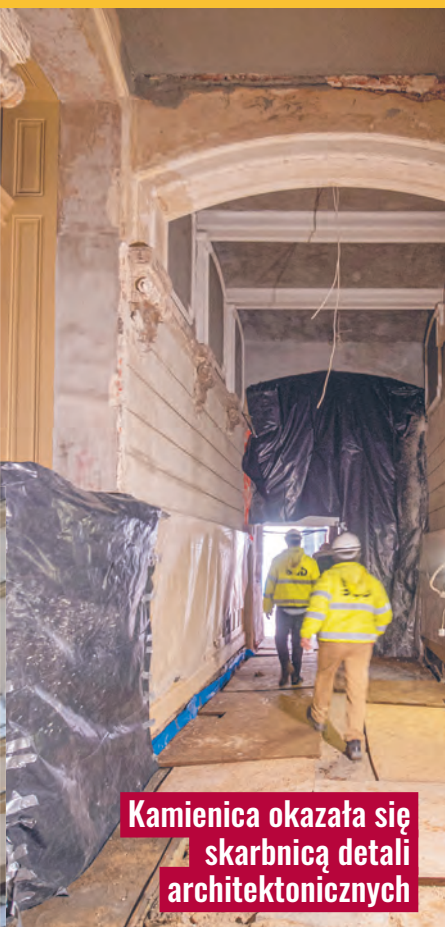
Kamienica okazała się skarbnicą detali architektonicznych