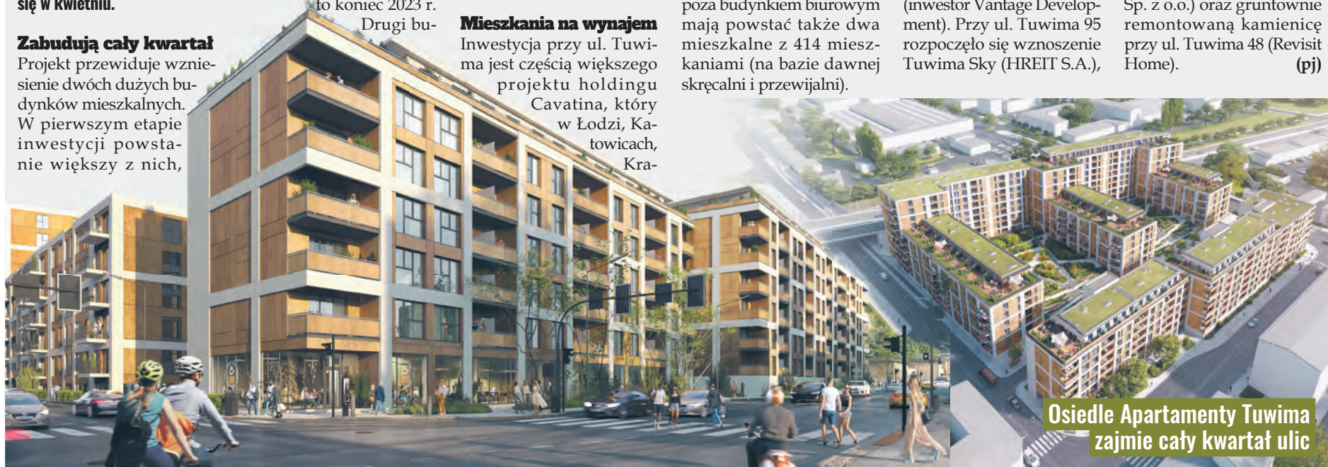
Osiedle Apartamenty Tuwima zajmie cały kwartał ulic

pierwszego z dwóch planowanych tam osiedli, które zaowocują łącznie blisko tysiącem mieszkań. Do tego można doliczyć jeszcze „Dom przy Tuwima” u zbiegu tej ulicy z ul. Wysoką (65 mieszkań, Domnax Sp. z o.o.) oraz gruntownie remontowaną kamienicę przy ul. Tuwima 48 (Revisit Home). (pj)