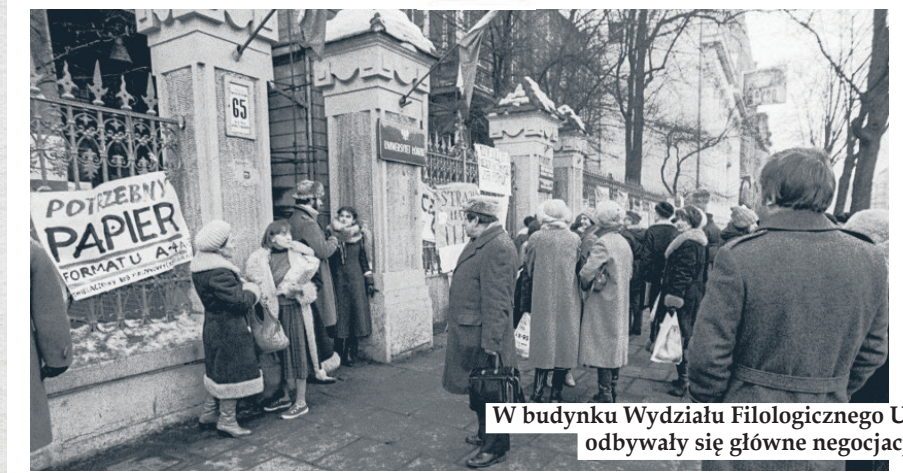
W budynku Wydziału Filologicznego UŁ odbywały się główne negocjacje

od 21 stycznia 1981 r., a 23 stycznia powołali Międzyuczelnianą Komisję Porozumiewawczą (MKP), która odtąd reprezentowała stanowisko strajkującej młodzieży akademickiej. Główne negocjacje odbywały się w gmachu UŁ przy al. Kościuszki 65.