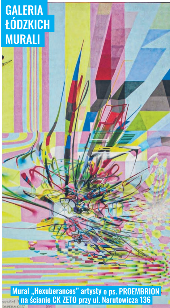
Mural „Hexuberances” artysty o ps. PROEMBRION na ścianie CK ZETO przy ul. Narutowicza 136