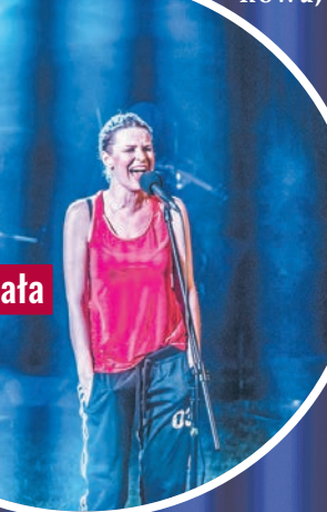
„Kobieta, która wpadła na drzwi”

w mrok szaleństwa genialnego artysty – Sergieja Rachmaninowa. Pianista cierpi na depresyjną paranoję i silne stany lękowe. Z pomocą przychodzą najbliżsi Rachmaninowa,