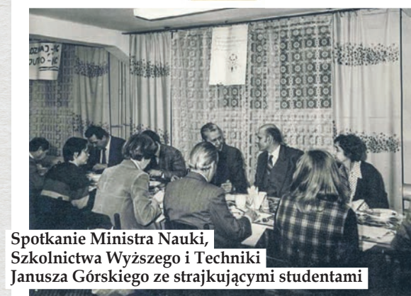
Spotkanie Ministra Nauki, Szkolnictwa Wyższego i Techniki Janusza Górkiego ze strajkującymi studentami

Tym tekstem z piosenki Agnieszki Osieckiej było podpisane na plakatach zdjęcie ministra Janusza Górkiego, który długo bronił swoich racji. Krajowa Komisja NSZZ „Solidarność” 12 lutego oświadczyła, że w pełni popiera akcję strajkową studentów Łodzi, Poznania i Warszawy. W następnych dniach doprowadzono do kompromisu w niemal wszystkich punktach studenckich postulatów, ale kolejny kryzys nastąpił, kiedy minister Górkowski (14 lutego) zażądał wprowadzenia poprawek do statutu NZS, w tym sugerującej uznanie kierowniczej roli