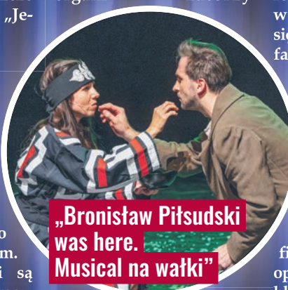
„Bronisław Piłsudski was here. Musical na wałki”