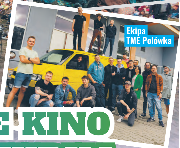
Ekipa TME Polówka