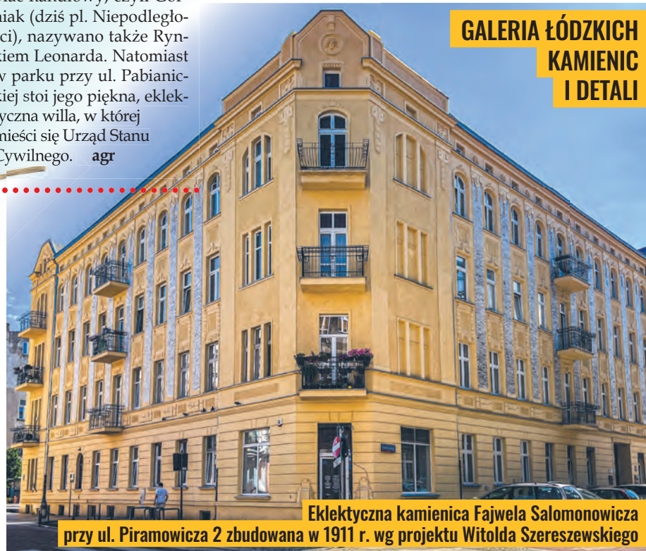
Eklektyczna kamienica Fajwela Salomonowicza przy ul. Piramowicza 2 zbudowana w 1911 r. wg projektu Witolda Szerszewskiego