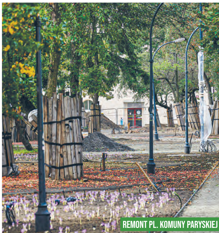
REMONT PL. KOMUNY PARYSKIEJ

nych budynków, a także ważnych przestrzeni publicznych.