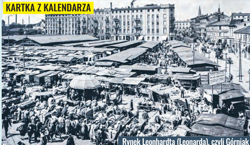
Rynek Leonhardta (Leonarda), czyli Górniak

budowano. To późniejsze obiekty przedziałni Arelan, zaadaptowane potem w części przez Wyższą Szkołę Informatyki. Ernst Leonhardt był aktywnym przedsiębiorcą, założycielem szkoły przyfabrycznej oraz współzałożycielem gimnazjum niemieckiego wzniesionego w la-