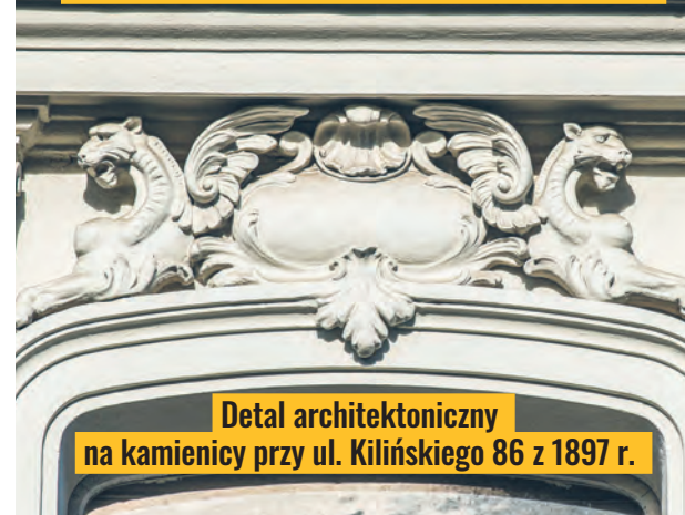
Detal architektoniczny na kamienicy przy ul. Kilińskiego 86 z 1897 r.

ŁÓDŹ.pl DLA SENIORA | DLA RODZINY | DLA KOCHAJĄCYCH ŁÓDŹ