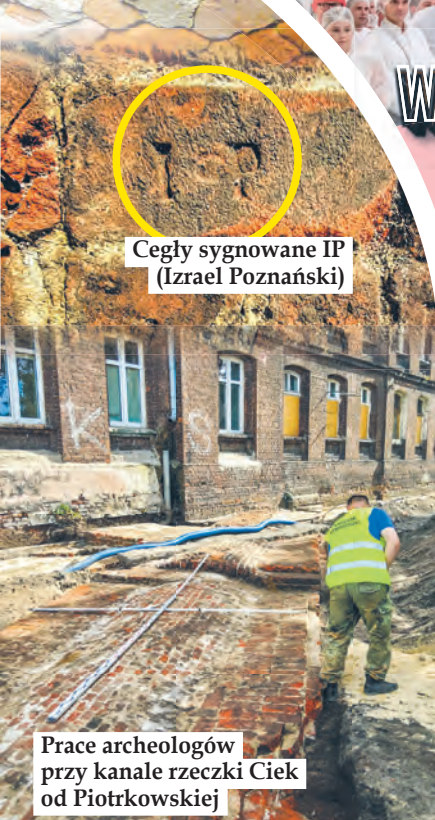
Cegły sygnowane IP (Izrael Poznański)