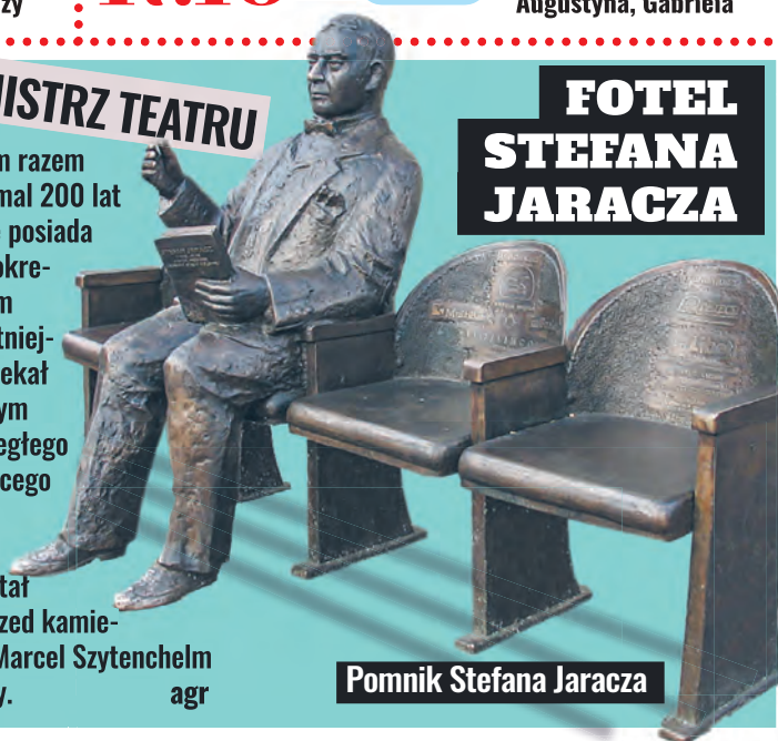
Pomnik Stefana Jaracza