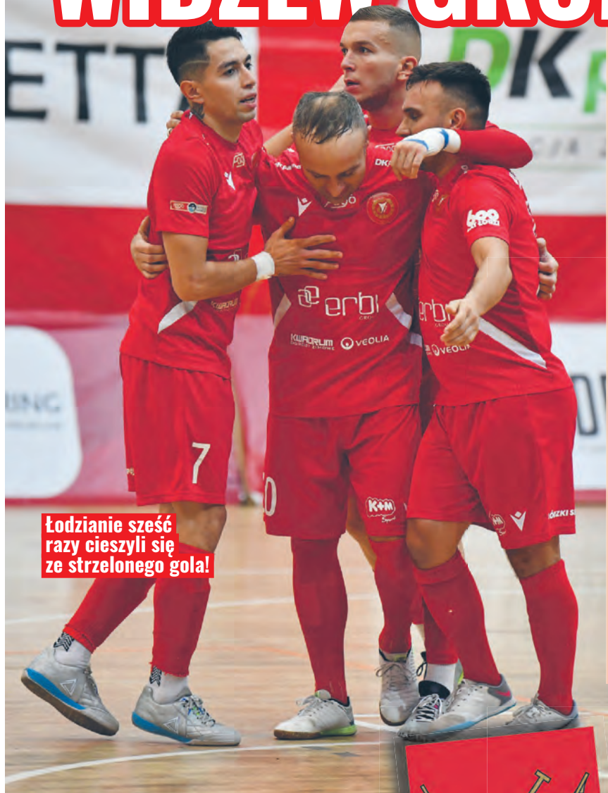
Łodzianie sześć razy cieszyli się ze strzelonego gola!