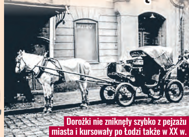
Dorożki nie zniknęły szybko z pejzażu miasta i kursowały po Łodzi także w XX w.