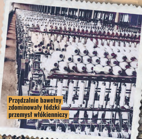
Przędzalnie bawełny zdominowały łódzki przemysł włókienniczy