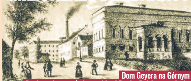
Dom Geyera na Górnym Rynku, gdzie mieścił się oddział Banku Polskiego w Łodzi