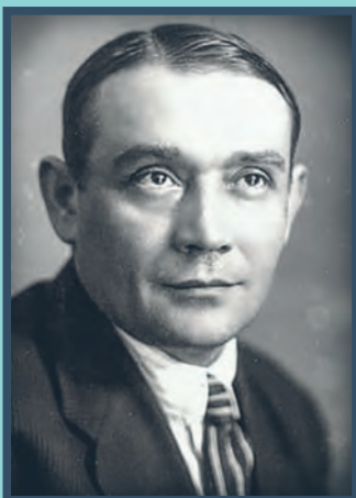
Stefan Jaracz w pierwszym okresie kariery

Stefan Jaracz – wybitny aktor teatralny i filmowy, reżyser, a także pisarz, publicysta i założyciel Teatru Ateneum w Warszawie – urodził się 24 grudnia 1883 r. w Żukowicach Starych pod Tarnowem. Już od młodych lat drzemał w nim niespokojny duch. Relegowany z tarnowskiego gimnazjum za działalność w organizacji „Promieniści”, maturę złożył eksternistycznie w 1903 r. w Bochni. Studiował potem na Uniwersytecie Jagiellońskim: prawo, historię sztuki, polonistykę i przyrodę,