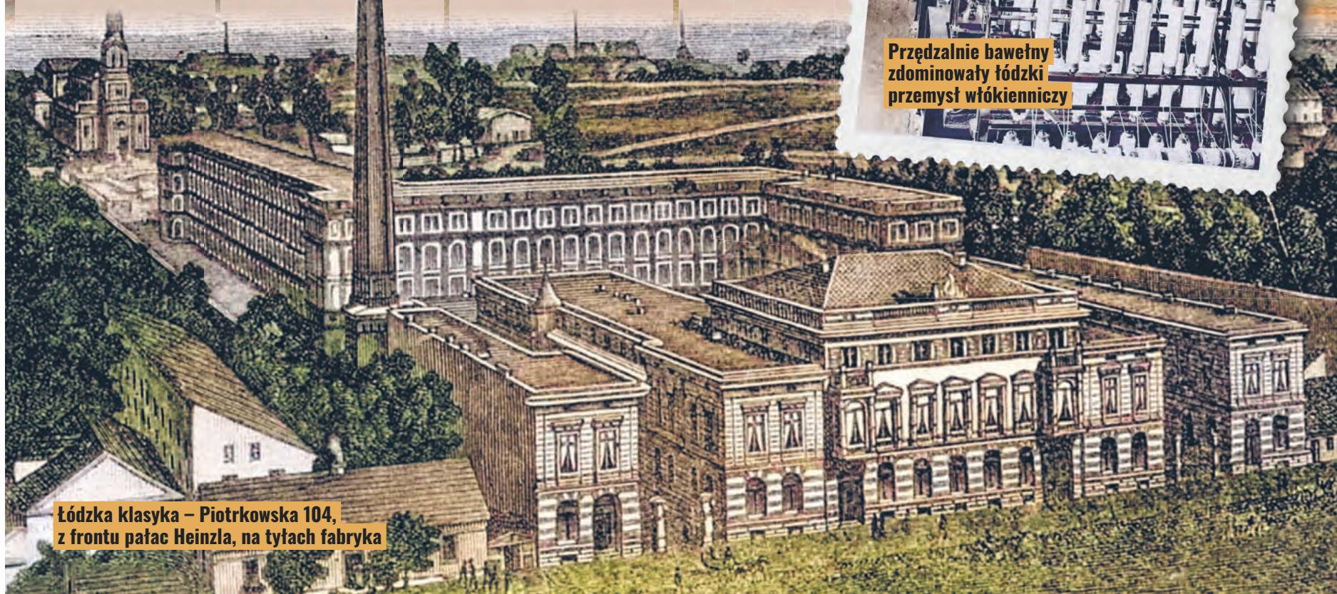
Łódzka klasyka – Piotrkowska 104, z frontu pałac Heinzla, na tyłach fabryka