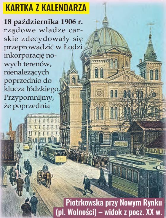
Piotrkowska przy Nowym Rynku (pl. Wolności) – widok z pocz. XX w.

18 października 1906 r. rządowe władze carskie zdecydowały się przeprowadzić w Łodzi inkorporację nowych terenów, nienależących poprzednio do klucza łódzkiego. Przypomnijmy, że poprzednia