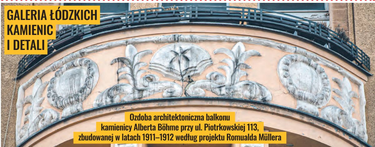
Ozdoba architektoniczna balkonu kamienicy Alberta Böhme przy ul. Piotrkowskiej 113, zbudowanej w latach 1911–1912 według projektu Romualda Müllera