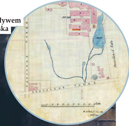
Lamus ze stawem i niewielkim dopływem na starej mapie. Teren parku Źródłiska

Powrót rzeki Lamus na powierzchnię wzbudza emocje nie tylko wśród łodzian. W ostatnich dniach o wyjątkowym łódzkim projekcie napisało „National Geographic Polska”, informując, że „to przedsięwzięcie unikatowe nie tylko w skali kraju, ale również całej Europy”.