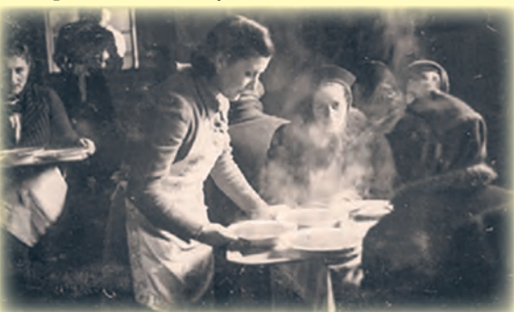
Gettowe kuchnie często uzupełniały skromne przydatki żywności zupą z brukwi lub warzywnych odpadków

ŁÓDŹ.pl DLA SENIORA | DLA RODZIN | DLA KOCHAJĄCYCH ŁÓDŹ