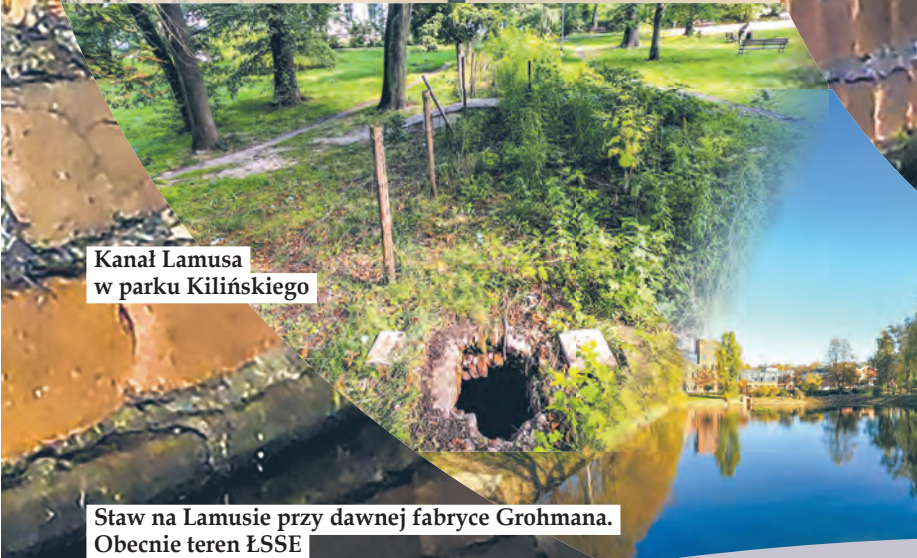
Kanał Lamusa w parku Kilińskiego