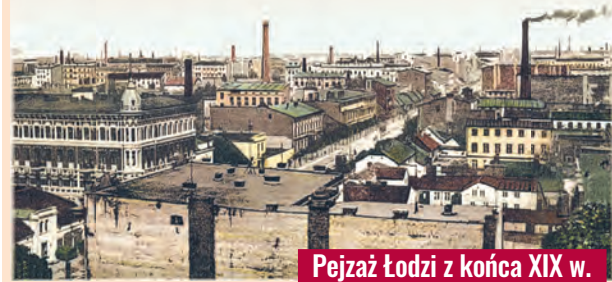
Pejzaż Łodzi z końca XIX w.

W II poł. XIX w. architektura budynków w łódzkich podwórkach się zmieniła. Nie przypominają one, jak dawniej, budynków mieszkalnych. Przystosowane do dużych maszyn tkackich i przędzalniczych stawały się wysokie i monumentalne. Parterowe domki na ul. Piotrkowskiej na tle czerwonych brył, wież ciśnieni i dymiących kominów fabrycznych stanowiły kontrast niespotykany w żadnym innym mieście Polski.