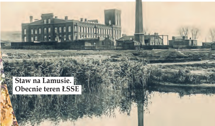
Staw na Lamusie. Obecnie teren ŁSSE