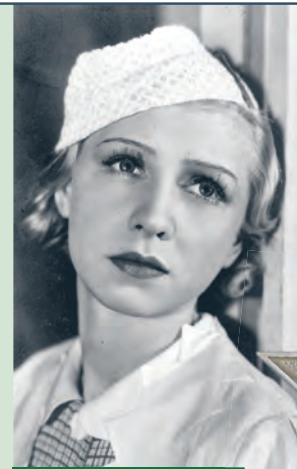
Jadwiga Andrzejewska i jej gwiazda w Alei Gwiazd w Łodzi

30 marca 1915 r. urodziła się w Łodzi Jadwiga Andrzejewska – wybitna aktorka teatralna i filmowa. Była córką maszynisty teatralnego. Po ukończeniu szkoły powszechnej ze względów materialnych podjęła pracę jako ekspedientka w składzie materiałów piśmiennych Tybera, przy ul. Piotrkowskiej 49, ale jednocześnie zadebiutowała w Teatrze Miejskim w Łodzi, w sztuce „Nauczycielka”, u boku Ireny Solskiej. Grała też w Teatrze Popularnym i występowała jako tancerka w kabarecie „Jar”, gdzie została zauważona przez Karola Adwentowicza, który zabrał ją do Warszawy. Debiut w stolicy na scenie Teatru Kameralnego w „Dziewczętach w mundurkach” 15 IX 1932 r. wypadł dobrze i posypały się propozycje z innych znanych teatrów, kabaretów oraz od twórców kina. Przed wojną zagrała w kilkunastu kasowych obra-