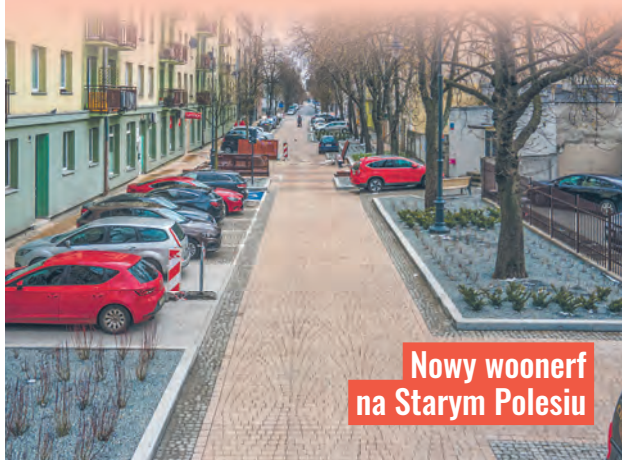
Nowy woonerf na Starym Polesiu