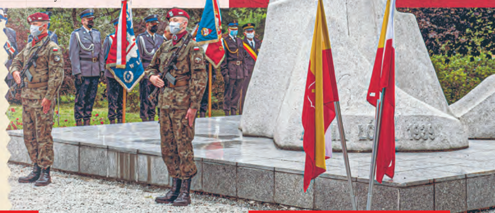
Pomnik upamiętniający Armię Łódź znajduje się w parku Helenów