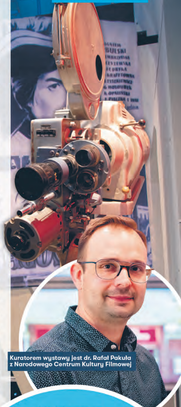
Kuratorem wystawy jest dr. Rafał Pakuła z Narodowego Centrum Kultury Filmowej

Podejrzewam, że kina studyjne będą tak długo funkcjonowały, jak grupka miłośników będzie chciała te instytucje utrzymać. Kina studyjne mają ważną rolę społeczną. Tak jest chociażby w samej Łodzi, gdzie wokół kin studyjnych zbierają się grupki sympatyków filmu, dzięki którym te miejsca jeszcze funkcjonują.