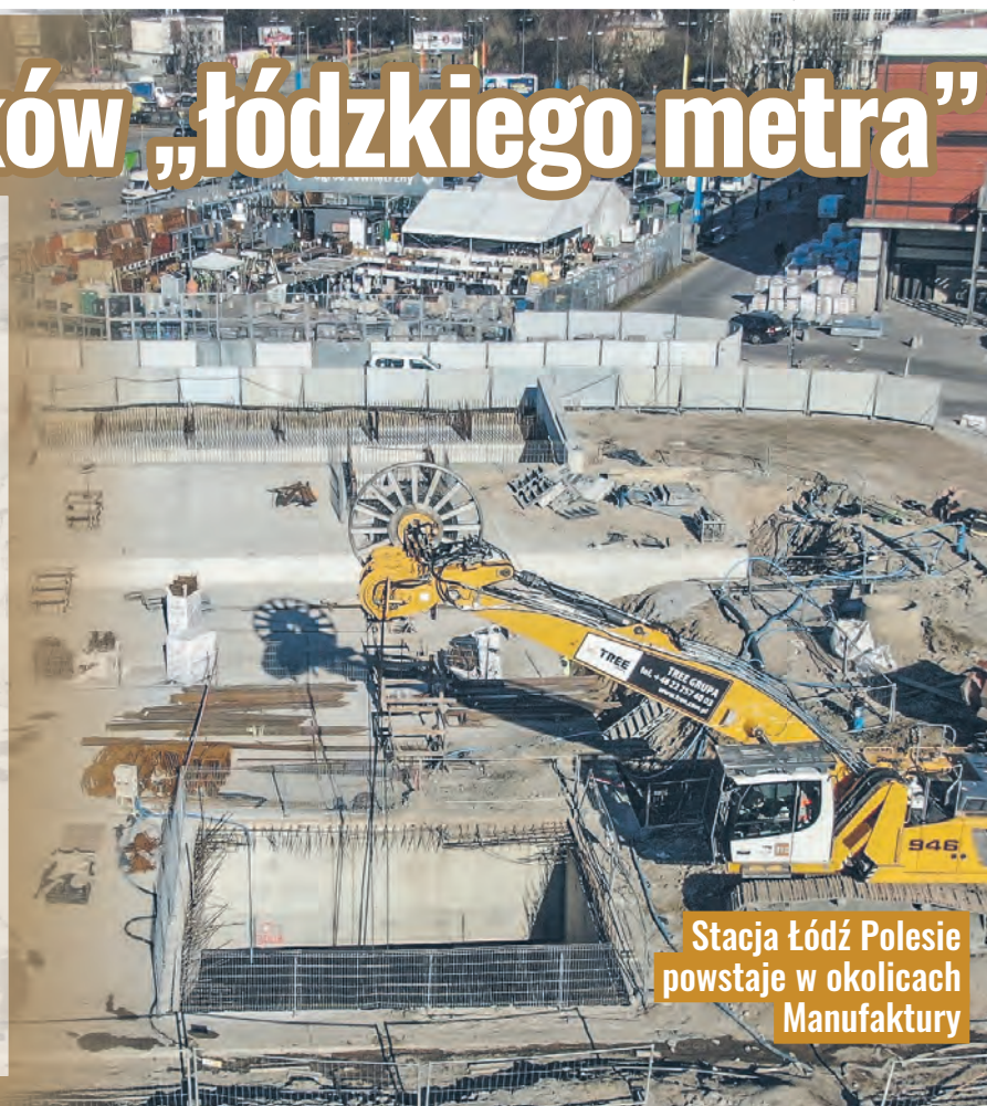
Stacja Łódź Polesie powstaje w okolicach Manufaktury