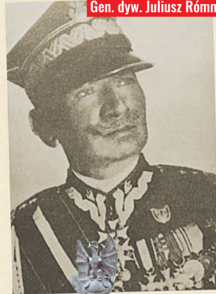
Gen. dyw. Juliusz Rómmel