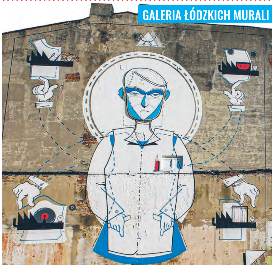
Mural „Drugie życie fabryki” na kamienicy przy ul. Pomorskiej 79 autorstwa toruńskiego artysty Andrzeja PoProstu