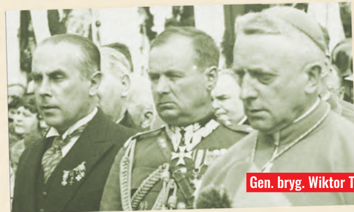
Gen. bryg. Wiktor Thommée