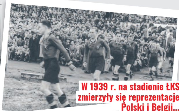
W 1939 r. na stadionie ŁKS zmierzyły się reprezentacje Polski i Belgii...