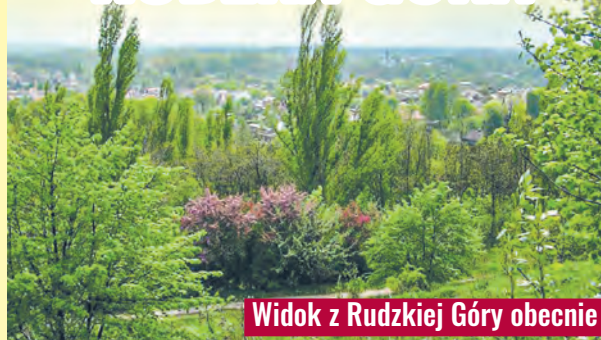
Widok z Rudzkiej Góry obecnie

zjeżdżać obecnie można na rolkowych wózkach. Ponadto u podnóża stała prawdziwa baczówka