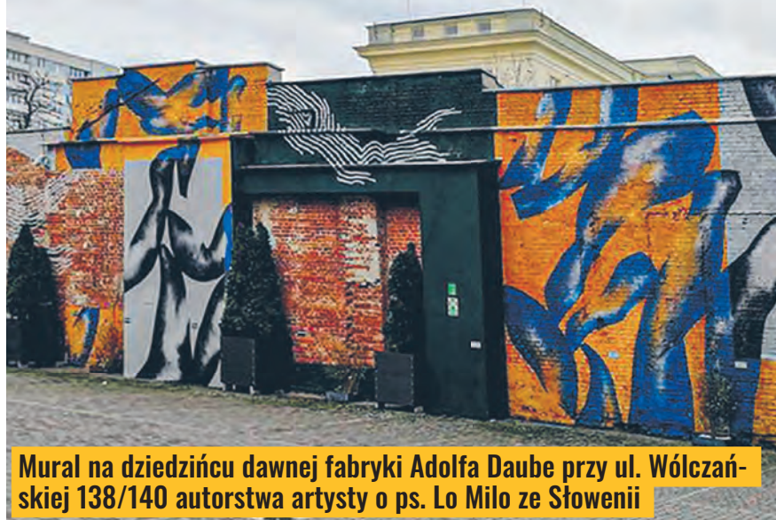
Mural na dziedzińcu dawnej fabryki Adolfa Daube przy ul. Wólczańskiej 138/140 autorstwa artysty o ps. Lo Milo ze Słowenii