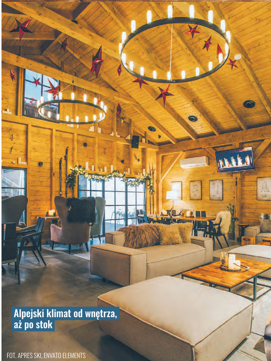
Alpejski klimat od wnętrza, aż po stok