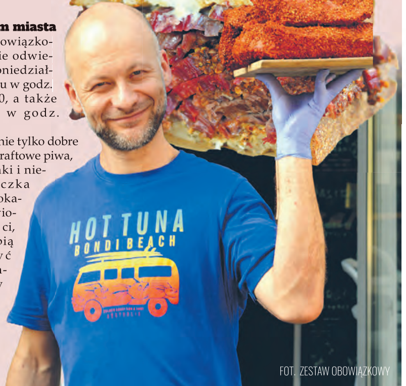
FOT. ZESTAW OBOWIĄZKOWY