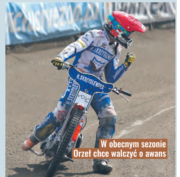
W obecnym sezonie Orzeł chce walczyć o awans