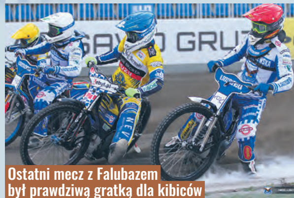
Ostatni mecz z Falubazem był prawdziwą gratką dla kibiców