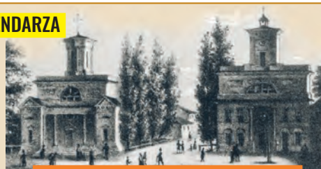
Rynek Nowego Miasta (dziś pl. Wolności) na litografii W. Walkiewicza z 1853 r.

Od 1841 r. Łódź zaliczono do rządu miast gubernialnych, co wiązało się z podniesieniem rangi burmistrza do