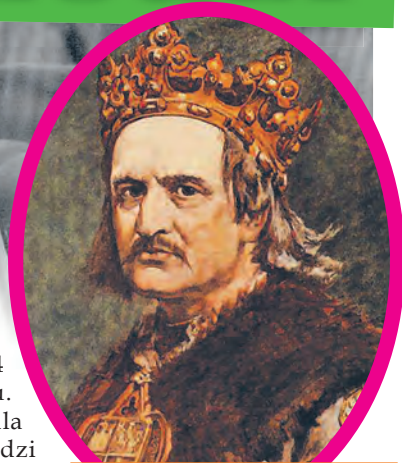
Król Jagiełło nadał Łodzi prawa miejskie 29 lipca 1423 r.

Dla uzyskania pełni uprawnień miejskich potrzebny był jeszcze przywilej monarszy. Na prośbę kolejnego biskupa wrocławskiego Jana Pelli wydał go Władysław Jagiełło „ipso die Sancte Marthe”, czyli w dniu św. Marty 29 lipca 1423 r. w Przedborzu. Przywilej z 1423 r. zawiera postanowienia dotyczące przekształcenia Łodzi