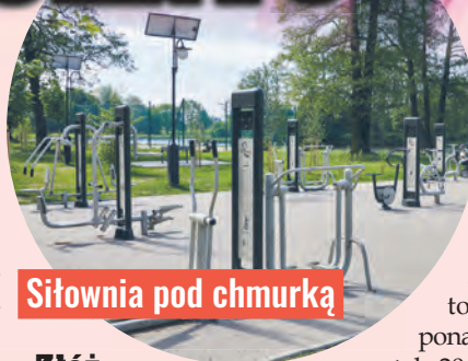
Siłownia pod chmurką

Tak jest chociażby w parku Podolskim, parku na Zdrowiu, na terenie lunaparku czy w Pasażu Abramowskiego. Miejsca te zyskały nowe atrakcje, a o ich atrakcyjności świadczą tłumy mieszkańców odwiedzających je każdego dnia.