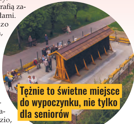
Teżnie to świetne miejsce do wypoczynku, nie tylko dla seniorów

dyrektorka Biura Aktywności Miejskiej. Spośród nietypowych projektów uwagę zwraca chociażby pomysł innowacyjnej zmiany w sygnalizacji świetlnej koło przejścia dla pieszych przy pomniku jednorożca. Zamiast tradycyjnej postaci człowieka na lampie sygnalizatora miałyby się pojawić właśnie jednorożce. Oprócz takich niecodziennych projektów Budżet Obywatelski to przede wszystkim wnioski dotyczące poprawy jakości życia i odpoczynku w mieście.