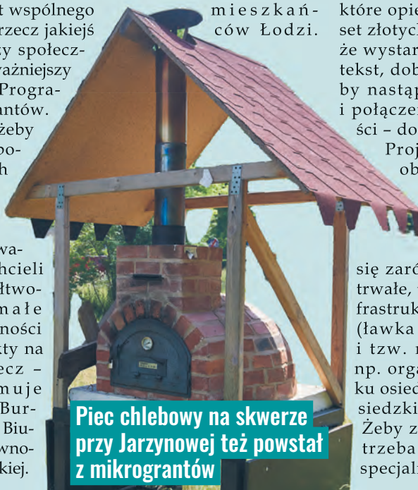
Piec chlebowy na skwerze przy Jarzynowej też powstał z mikrograntów

WIĘCEJ INFORMACJI O PROGRAMIE: CENTRUM PROMOCJI I ROZWOJU INICJATYW OBYWATELSKICH OPUS UL. NARUTOWICZA 8/10, 90-135 ŁÓDŹ TEL. (42) 207 73 39; 509 899 449 OPUS@OPUS.ORG.PL