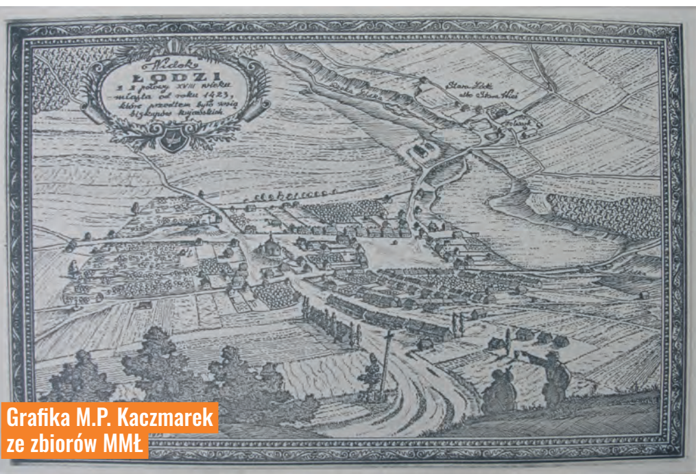
Grafika M.P. Kaczmarek ze zbiorów MMŁ