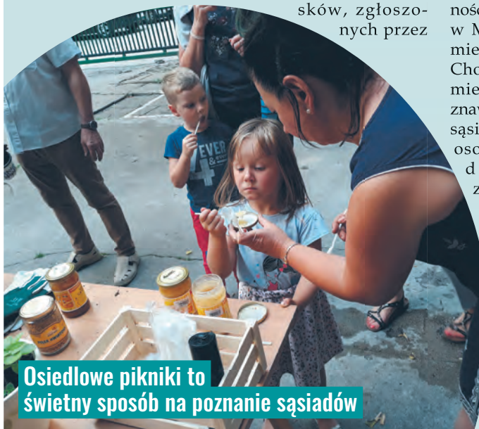
Osiedlowe pikniki to świetny sposób na poznanie sąsiadów