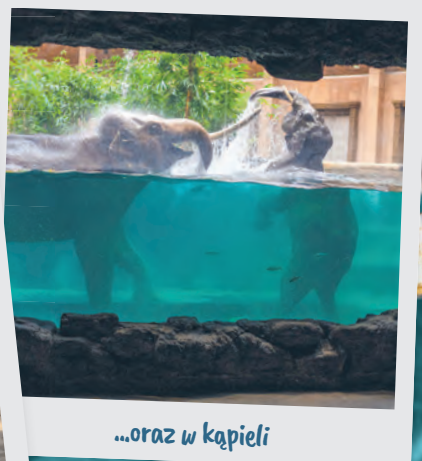
...oraz w kąpiel