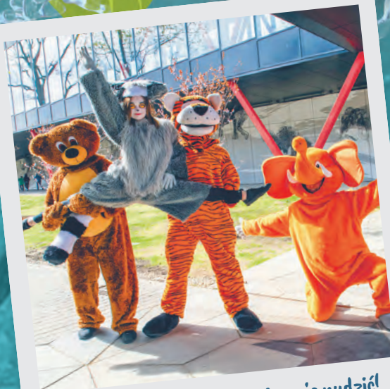
W Orientarium ZOO nie można się nudzić!