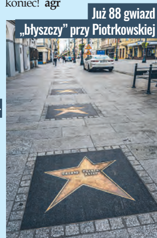
Już 88 gwiazd „błyszczą” przy Piotrkowskiej

z kulturą. Od 4 czerwca 2018 r. operatorem Łódzkiej Alei Gwiazd jest Narodowe Centrum Kultury Filmowej w Łodzi, w ramach projektu Łódź Miasto Filmu UNESCO. A gwiazd tych, honorujących największych artystów polskiego kina, mamy już 88 i to nie jest koniec! agr