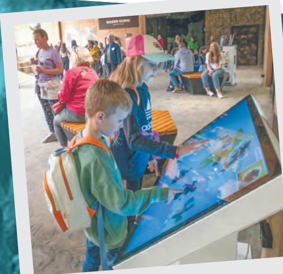
Interaktywne gry i zabawy