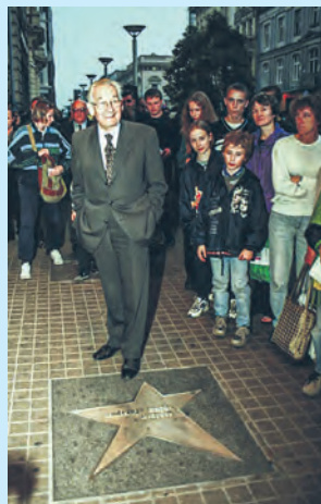
Andrzej Wajda ostonił swoją gwiazdę w Alei Gwiazd w 1998 r.

Po wschodniej, parzystej stronie znajdują się gwiazdy reżyserów, operatorów,