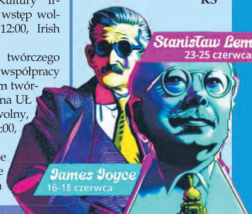
Stanisław Lem 23-25 czerwca