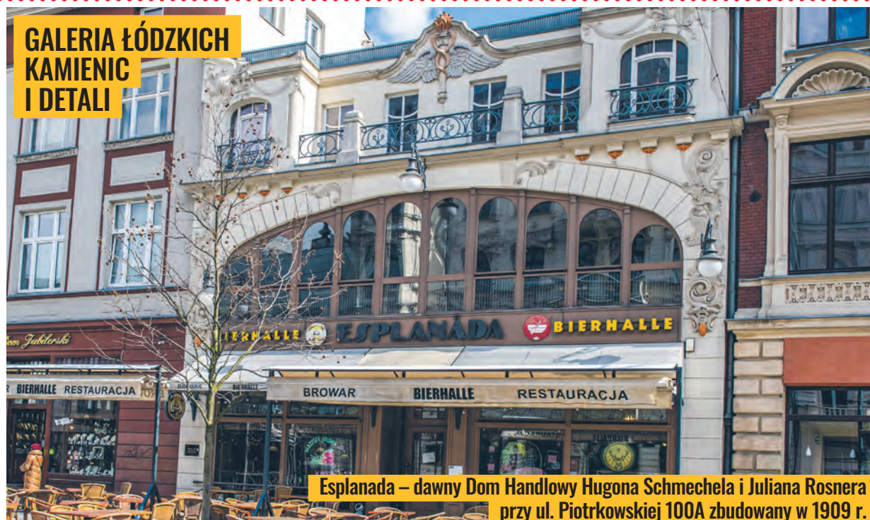
Esplanada – dawny Dom Handlowy Hugona Schmechela i Juliana Rosnera przy ul. Piotrkowskiej 100A zbudowany w 1909 r.