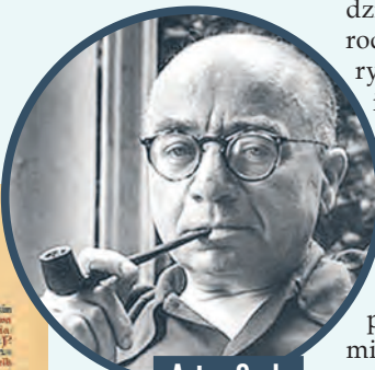
Artur Szyk i karta ze Statutu Kaliskiego

do „Rewolucji w Niemczech” Tuwima, wydanej w 1919 r., brał udział w wy-