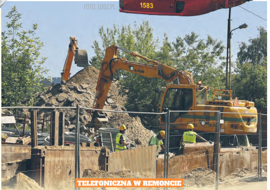
TELEFONICZNA W REMONCIE