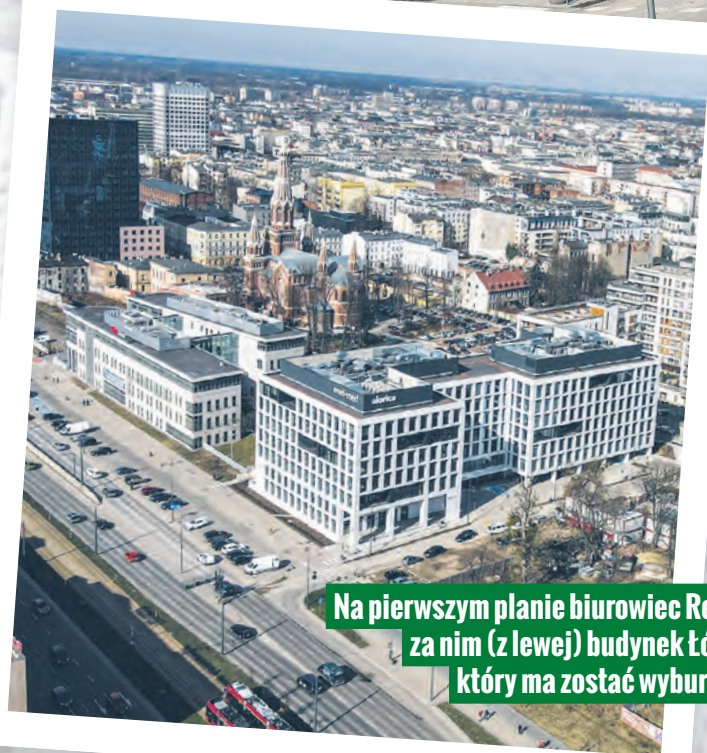
Na pierwszym planie biurowiec ReAct, za nim (z lewej) budynek Łódź 1, który ma zostać wyburzony