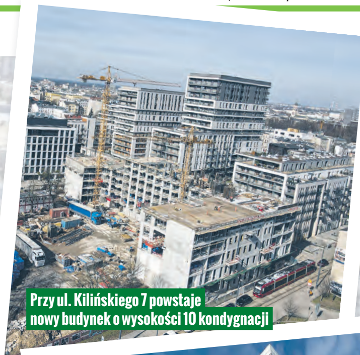
Przy ul. Kilińskiego 7 powstaje nowy budynek o wysokości 10 kondygnacji