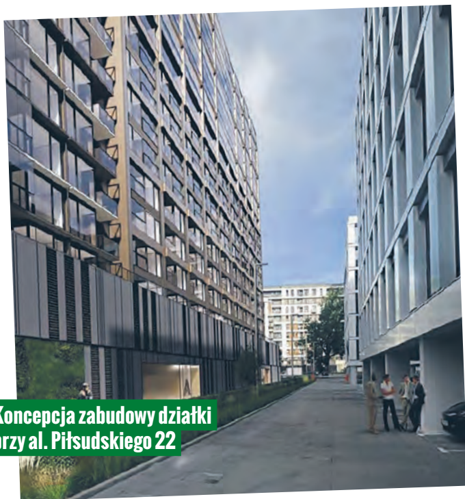
Koncepcja zabudowy działki przy al. Piłsudskiego 22

Tak może wyglądać nowa obudowa pierzei al. Piłsudskiego. Wizualizację niezrealizowanych jeszcze inwestycji przygotowali architekci pracowni Loesch + Partnerzy, autorzy koncepcji architektonicznej kompleksu Prime Łódź 1