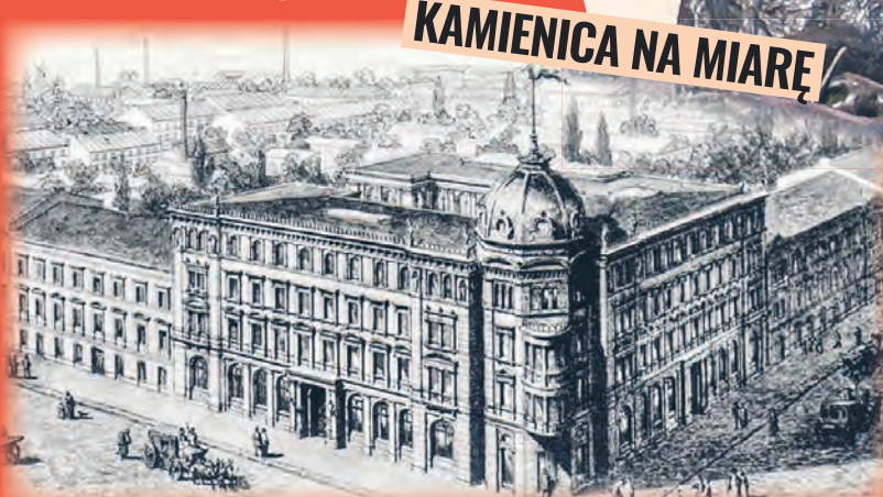
Kamienica Scheiblera przy ul. Piotrkowskiej 11 – zdjęcie archiwalne

zwieńczonym kopułą z ozdobnym masztem. Na elewacji można dostrzec motywy wzorowane na włoskim renesansie. Była to jedna z pierwszych – jak przystało na „króla bawełny” – tak okazałych kamienic w mieście. agr