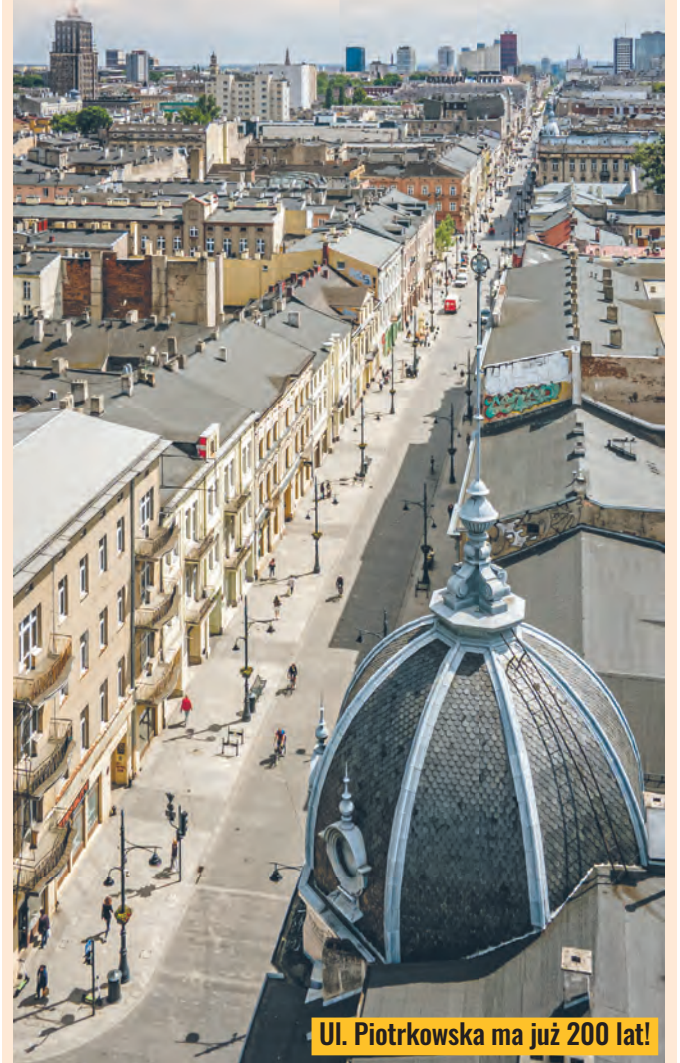
Ul. Piotrkowska ma już 200 lat!

umieszczono właśnie pierwszy słup z napisem „ulica Piotrkowska”. W 1828 r. pismo rządowe stwierdzało natomiast: „Ulica główna Piotrkowska przez osadę sukienniczą Łódź i osadę Iniano-bawelnianą Łódka przechodzi”. Dawny odcinek Piotrkowskiej – od Rynku Nowego Miasta do obecnej ul. Zgierskiej – otrzymał nazwę ulicy Nowomiejskiej dopiero we wrześniu 1863 r. Natomiast zaludnianie ul. Piotrkowskiej zaczęło się w 1824 r. Od Rynku Nowego Miasta (pl. Wolności) do ul. Cegielnianej (ul. Jaracza) osiedlano sukienników – głównie przybyszy z Dolnego Śląska i Wielkopolski. Południową część ul. Piotrkowskiej – od ul. Dzielnej (ul. Narutowicza) do Górnego Rynku (pl. Reymonta) – zajmowali tkacze bawełny i lnu ze Śląska, Saksonii, Czech i Prus. agr