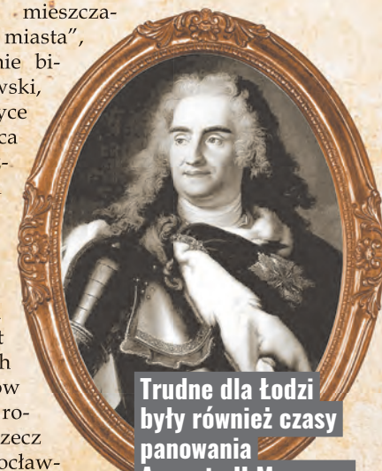
Trudne dla Łodzi były również czasy panowania Augusta II Mocnego (1697–1733)

bierali sami mieszczanie, ale „pan miasta”, czyli formalnie biskup włocławski, a w praktyce – dzierżawca klucza łódzkiego – ten wybór zatwierdzał. Mieszczanie łódzcy zobowiązani byli do opłat podatkowych oraz czynszów w naturze i robocizny na rzecz biskupa włocławskiego, a w rzeczywistości – na rzecz mianowanego przez niego dzierżawcę, co nieraz wywoływało konflikty. Rola Kościoła w życiu małej Łodzi była jednak znacząca. Generalnie władze i opinia publiczna wywierały presję na przestrzeganie norm religijnych i dyscyplinę nabożeństw, a liczne uroczystości i święta przybierały charakter misterii. Taka atmosfera sprzyjała – oprócz przekazywania obowiązkowych danin – składaniu innych darów, a czasem sporządzaniu w testamentach