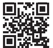
FOT. ŁÓDŹ.PL, WIZUALIZACJA