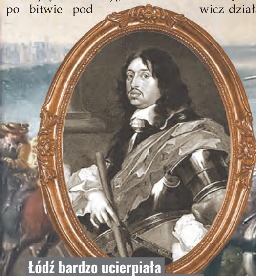
Łódź bardzo ucierpiała podczas najazdu szwedzkiego w latach 1655–1660