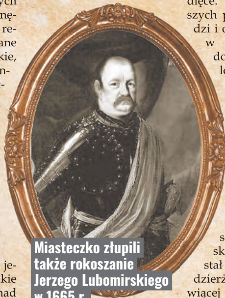
Miasteczko złupili także rokoszanie Jerzego Lubomirskiego w 1665 r.

gicznie, sprowadzając konsyliarzy z Włocławka i Wolborza. Pomagał również w pochówkach, ale sam się zaraził i zmarł. Epidemia dotarła do Łodzi także w 1675 r. I tak przez burzliwy okres II połowy XVII w. uby-