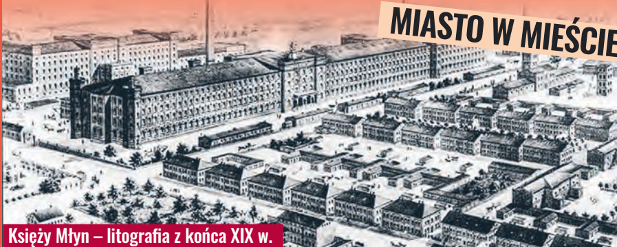
Księży Młyn – litografia z końca XIX w.