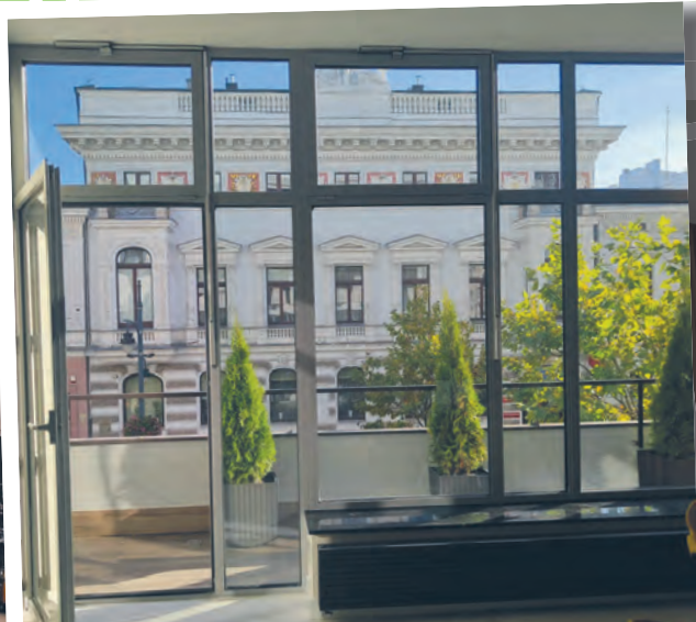
W SALACH DAWNEJ RATUSZOWEJ