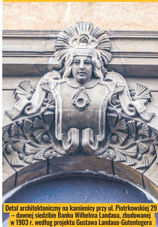
Detal architektoniczny na kamienicy przy ul. Piotrkowskiej 29 – dawniej siedzibie Banku Wilhelma Landaua, zbudowanej w 1903 r. według projektu Gustawa Landaua-Gutentegera