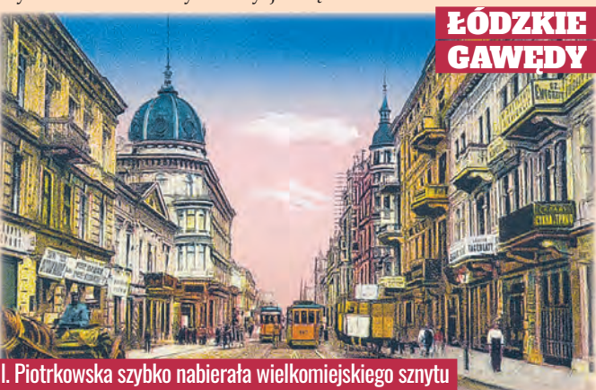
Dzięki akcji kredytowej ul. Piotrkowska szybko nabierała wielkomiejskiego sznytu