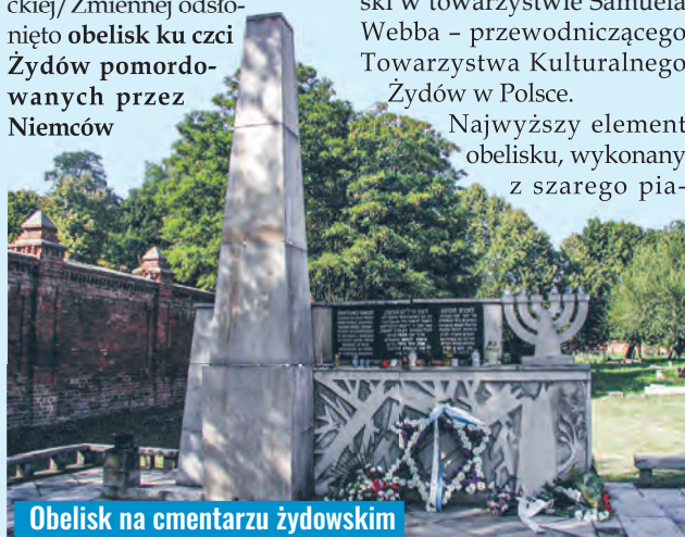
Obelisk na cmentarzu żydowskim

29 listopada 1959 r. na cmentarzu żydowskim przy ul. Brackiej/Zmiennej odsłonięto obelisk ku czci Żydów pomordowanych przez Niemców