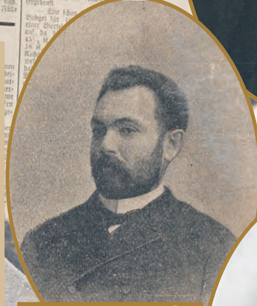
Henryk Elzenberg – twórca „Dziennika Łódzkiego”