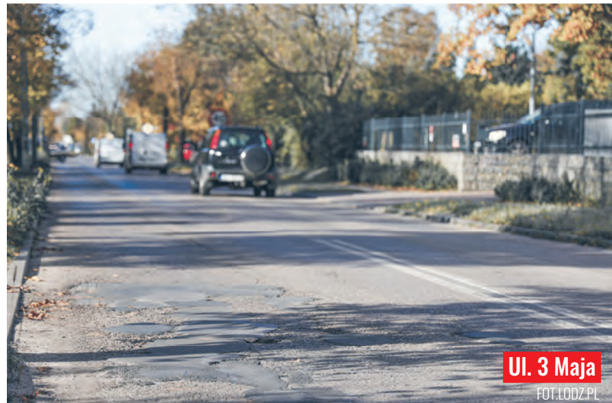
Ul. 3 Maja

Natomiast w czwartek, 30 listopada, rozpoczyna się prace na ul. 3 Maja. Przebudowę drogi poprzedzi wymiana wodociągu, remont nawierzchni ruszy wiosną. Roboty wodociągowe będą podzielone na kilka etapów. Pierwszych utrudnień w ruchu pojazdów (objazdy) należy spodziewać się między ul. Świetlicową a ul. Morską.