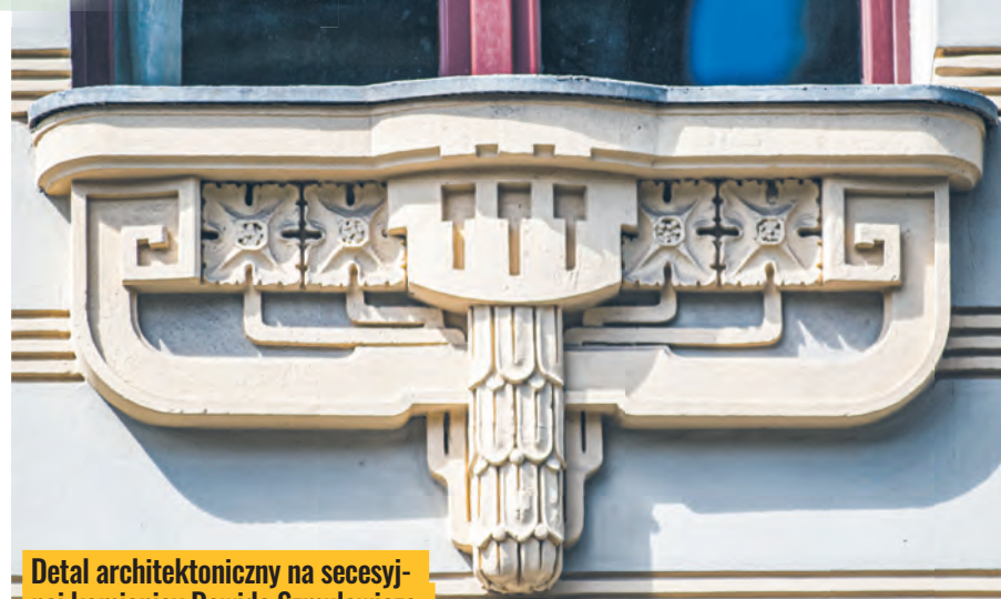
Detal architektoniczny na secesyjnej kamienicy Dawida Szmulowicza przy ul. Piotrkowskiej 37, zbudowanej w 1904 r. wg projektu Gustawa Landaua-Gutentegera