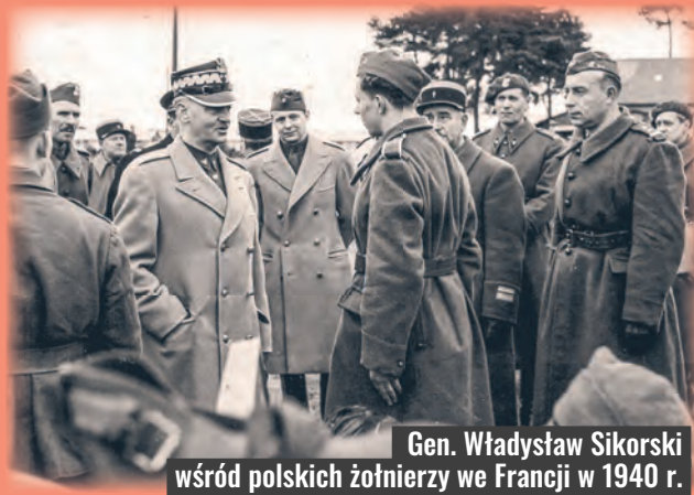
Gen. Władysław Sikorski wśród polskich żołnierzy we Francji w 1940 r.

jednak do siebie i rozpoczął pościg za złodziejami, skutecznie doganiając jednego z nich. Oddając strzał ostrzegawczy w powietrze, skutecznie powstrzymał drugiego. Obaj sprawcy, 22-letni mieszkańcy Chojen zostali doprowadzeni w kajdankach na komisariat, gdzie tłumaczyli swój występek chęcią zdobycia pieniędzy na zbliżające się święta. Śledztwo wykazało, że w nocy złodzieje włamali się – przez wypchnięcie szyby – do siedziby Klubu Sportowego „Sokół” przy ul. Emilii i wynieśli z biura maszynę do pisania razem ze stolikiem. Łupy mieli spieniężyć na jutro u pasera. Sąd opuścił im zarzut zamachu na policjanta na służbie, ale skazał młodych chojniaaków na trzy miesiące za usiłowanie kradzieży. Święta nie były raczej zbyt udane.