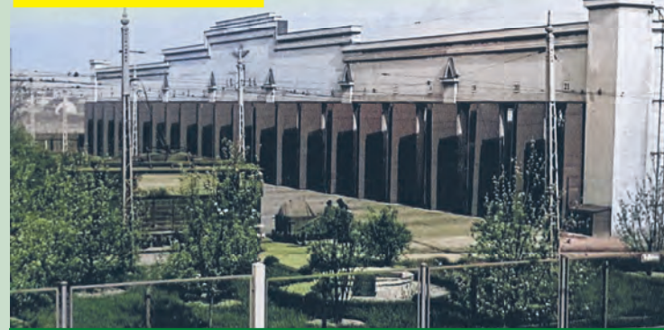
Budynek drugiej zajezdni tramwajowej w Łodzi

ŁÓDŹ.pl DLA SENIORA | DLA RODZIN | DLA KOCHAJĄCYCH ŁÓDŹ