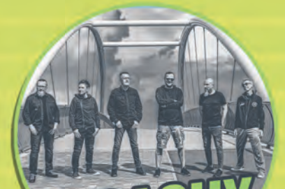
STRACHY NA LACHY