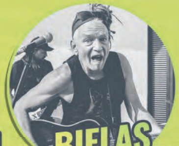
BIELAS I MARYNARZE