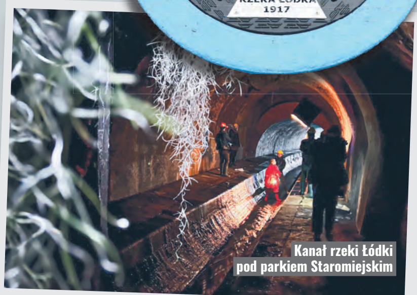
Kanał rzeki Łódki pod parkiem Staromiejskim