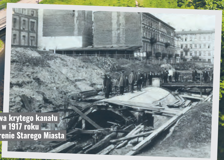
Budowa krytego kanału Łódki w 1917 roku na terenie Starego Miasta

Rzekę Łódkę na powierzchni można podziwiać m.in. w parku Helenowskim