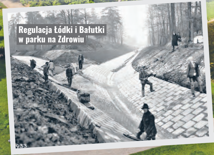
Regulacja Łódki i Bałutki w parku na Zdrowiu