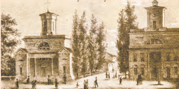
Włoskie topole przy wejściu na ul. Piotrkowską od strony Rynku Nowego Miasta (pl. Wolności) na litografii z poł. XIX w.

Drugą szkółkę topoli założono w 1829 r. w osadzie Łódka przy ul. Piotrkowskiej 184. W 1835 r. trakt piotrkowski został obsadzony topolami, ale dosyć nie-odbale – drzewka rosły w nierównych odstępach, a niektóre trzeba było przesadzać. Niestety okazało się, że drzewa zasłaniały światło bardzo potrzebne tkaczom podczas pracy, więc tzw. adiunkt, dozorca miasta pilnujący porządku w osadach przemysłowych, zabronił sadzenia drzewek przed oknami. Część topoli posadzono także na przecznicach Piotrkowskiej i na pustych placach na rynkach, a ich strzeliste kształty nadały ulicom malowniczy wygląd. agr