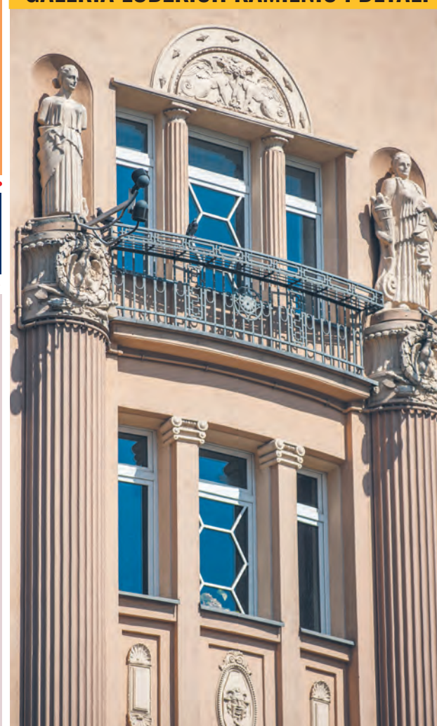
Detale architektoniczne budynku dawnego hotelu Polonia Residence przy ul. Narutowicza 38, zbudowanego w latach 1910–1912 przez rodzinę Dobrzyńskich