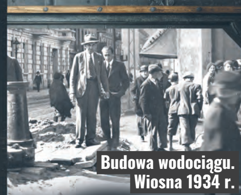
Budowa wodociągu. Wiosna 1934 r.

Wiosną 1934 roku na ulicy Żeromskiego (od ulicy Zielonej w kierunku ulicy Legionów) zaczęto układać pierwszy odcinek wodociągu. W tym czasie ruszyły też wiercenia studni głębinowych nad rzeką Olechówką (współcześnie to ulica Kolumny) i we wsi Górki Stare (współcześnie to ulica Zygmunta). Zaczęła się budowa zbiorników wody na Stokach, do których rurociągiem, przez stację uzdatniania na Dąbrowie, miała płynąć woda z trzech pierwszych miejskich studni głębinowych. Z budową wodociągu bardzo długo zwlekano. Władze Łodzi za priorytet uznały poprawę stanu sanitarnego miasta, dlatego najpierw budowano sieć kanałów, którymi chorobotwórcze ścieki wyprowadzono z miasta do oczyszczalni na Lublinku. Dzięki likwidacji rynsztoków i skierowaniu ścieków pod ziemię do kanałów poprawił się także wygląd miasta, a każda ze śródmiejskich ulic zyskała dodatkowo od 1 do 3 metrów szerokości.