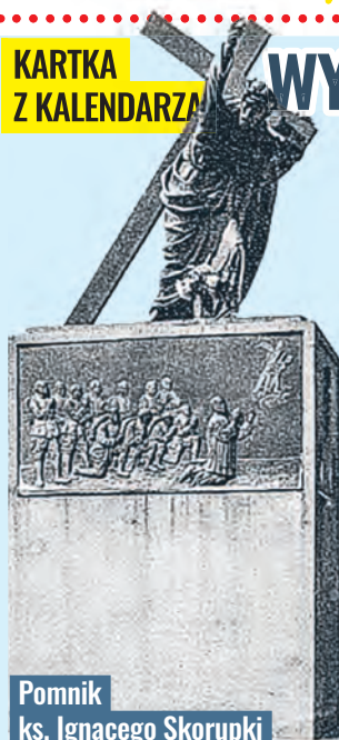
Pomnik ks. Ignacego Skorupki na pl. Katedralnym

nictwa i brązownictwa. W 1927 r. zamieszkał w Łodzi, gdzie został organizatorem Wydziału Złotniczego w Państwowej Szkole Przemysłowej Żeńskiej przy ul. Narutowicza 77. Ponadto działał jako członek Cechu Jubilerów, Grawerów i Zegarmistrzów. W 1931 r. założył Polski Związek Zawodowy Łódzkich Artystów Plastyków, a po II wojnie światowej został kierownikiem działu galanterii metalowej w Wyższej Szkole Sztuk Plastycznych w Łodzi. Od 1927 r. wystawiał prace w Miejskiej Galerii Sztuki.