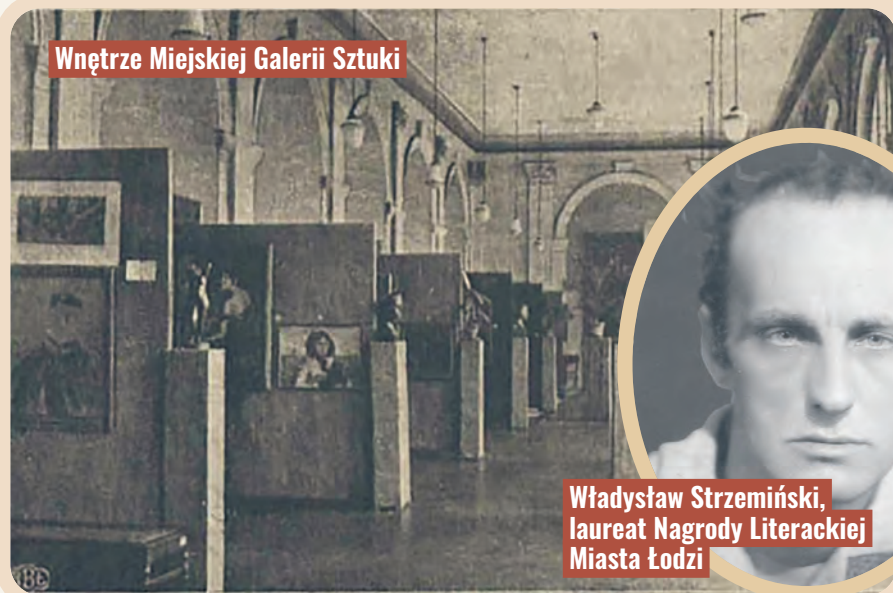
Władysław Strzemiński, laureat Nagrody Literackiej Miasta Łodzi