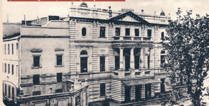
Gmach Teatru Wielkiego w Łodzi przy ul. Konstytucyjnej (dziś ul. Legionów), który spłonął w 1920 r.

tyk sztuki, twórca unizmu, współorganizator grupy „a.r.” i Galerii Sztuki Nowoczesnej w Łodzi – Władysław Strzemiński.