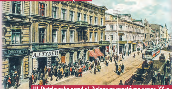
Ul. Piotrkowska przed ul. Zieloną na pocz. XX w.