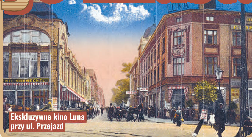
Ekсклюzywne kino Luna przy ul. Przejazd

Z inicjatywą przyznawania takiej nagrody wystąpił Związek Zawodowy Literatów Polskich (ZZLP). Pierwszym miastem, które podjęło tę inicjatywę, była Warszawa, a potem inne, w tym także Łódź. 27 września 1926 r. ZZLP zwrócił się do Rady Miejskiej Łodzi z apelem o ufundowanie nagrody dla polskich literatów. Ogłoszenie laureata zaplanowano na dzień Święta Narodowego 3 Maja. Ustanowioną w 1927 r. Nagrodę Literacką Miasta Łodzi w 1931 r. przekształcono w Nagrodę Miasta Łodzi dla Literatury Pięknej, Nauki i Sztuk Plastycznych. W 1928 r. otrzymał ją łodzianin, poeta Julian Tuwim, w 1930 r. laureatem został wybitny historyk literatury, prof. Uniwersytetu Berlińskiego Aleksander Bruckner. W 1931 r. po zmianie profilu nagrody, z powodu trudności finansowych samorządu łódzkiego w dobie kryzysu, nagrody nie przyznano. W 1932 r. otrzymał ją młody malarz i wybitny teore-